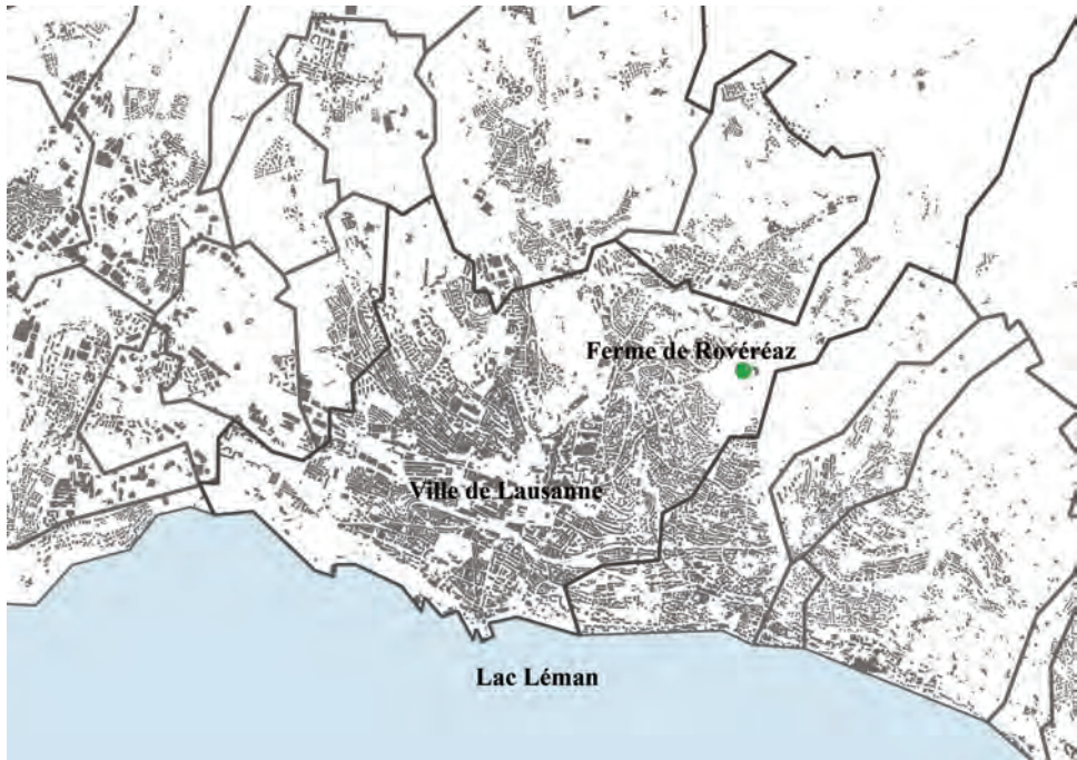
Figure 1. Localisation du domaine de Rovéréaz

propose un business plan incluant un plan de financement détaillé. Par ailleurs un jury d'experts, composé de représentants des services communaux (urbanisme, jeunesse, domaines), du monde agricole, de la recherche, du patrimoine, est créé pour accompagner la ville dans le choix des futurs exploitants. Alors que 8 projets ont été soumis lors de la première étape et 4 sélectionnés, seules deux équipes ont finalement soumis un projet lors de la seconde étape. Les équipes qui se sont retirées ont souligné l'impossibilité de proposer un projet viable économiquement dans les conditions-cadres proposées par la ville. C'est finalement le projet « Rovéréaz, ferme agroécologique » qui a remporté l'appel d'offres. Avec ce choix, la ville de Lausanne confirme une volonté d'innover en privilégiant une équipe de jeunes actifs nouveaux venus dans l'agriculture.