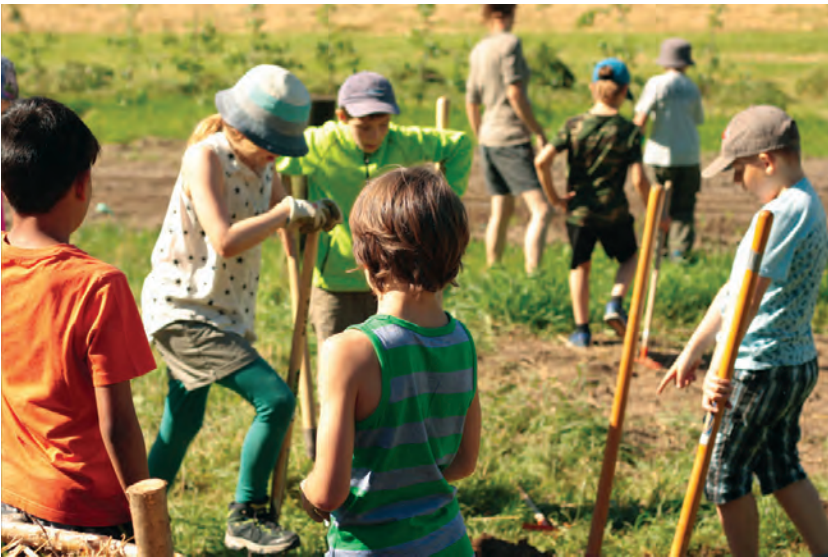
Initiation à la permaculture et accueil pédagogique (rovereaz.ch 2018)