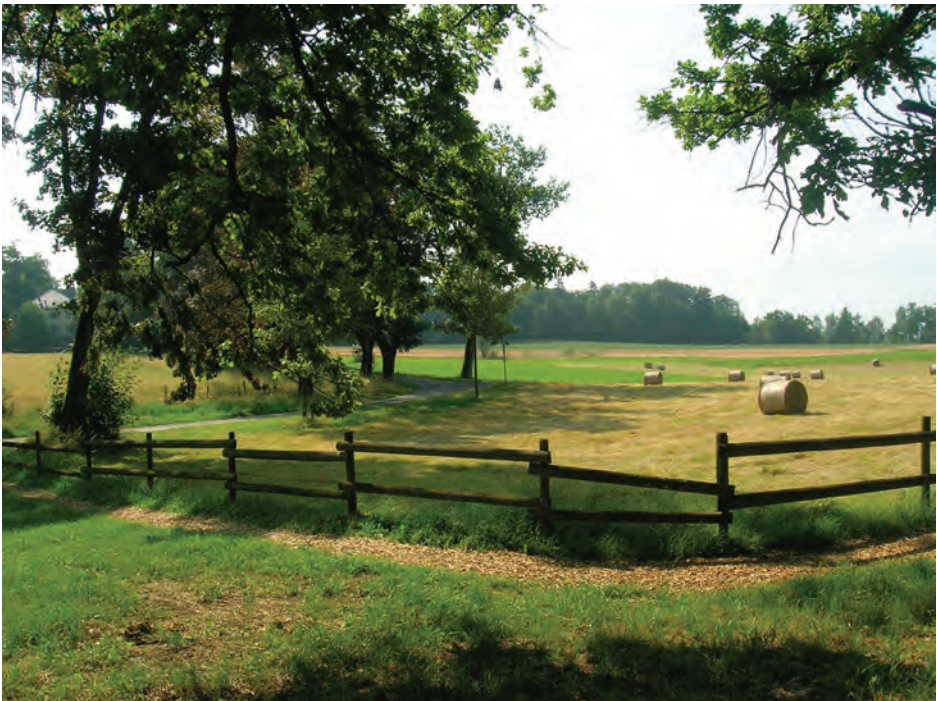
Le domaine de Rovéréaz : bâti rural et prairies