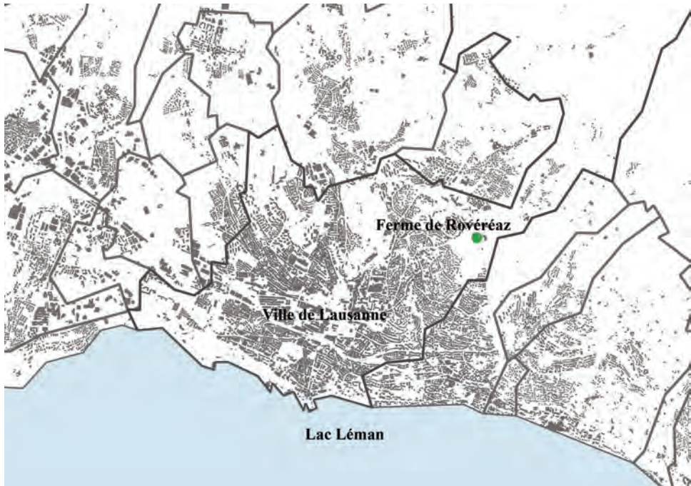
Figure 1. Localisation du domaine de Rovéréaz

propose un business plan incluant un plan de financement détaillé. Par ailleurs un jury d'experts, composé de représentants des services communaux (urbanisme, jeunesse, domaines), du monde agricole, de la recherche, du patrimoine, est créé pour accompagner la ville dans le choix des futurs exploitants. Alors que 8 projets ont été soumis lors de la première étape et 4 sélectionnés, seules deux équipes ont finalement soumis un projet lors de la seconde étape. Les équipes qui se sont retirées ont souligné l'impossibilité de proposer un projet viable économiquement dans les conditions-cadres proposées par la ville. C'est finalement le projet « Rovéréaz, ferme agroécologique » qui a remporté l'appel d'offres. Avec ce choix, la ville de Lausanne confirme une volonté d'innover en privilégiant une équipe de jeunes actifs nouveaux venus dans l'agriculture.