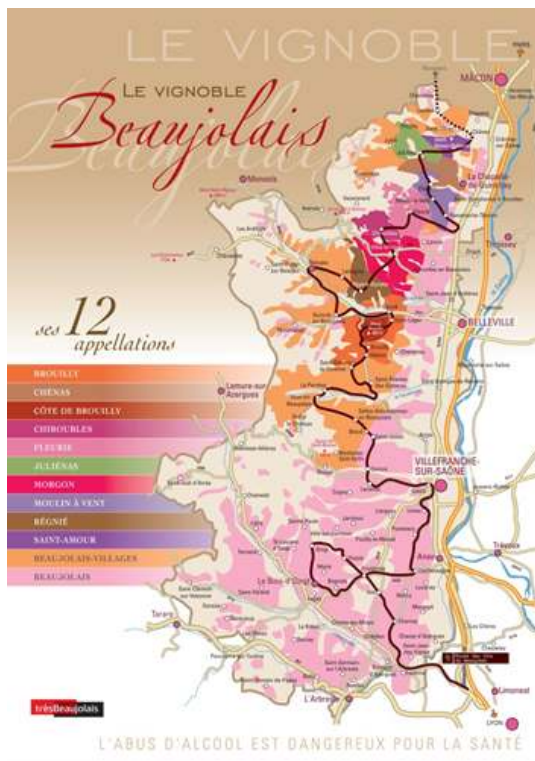
Figure 2. Le territoire viticole du Beaujolais