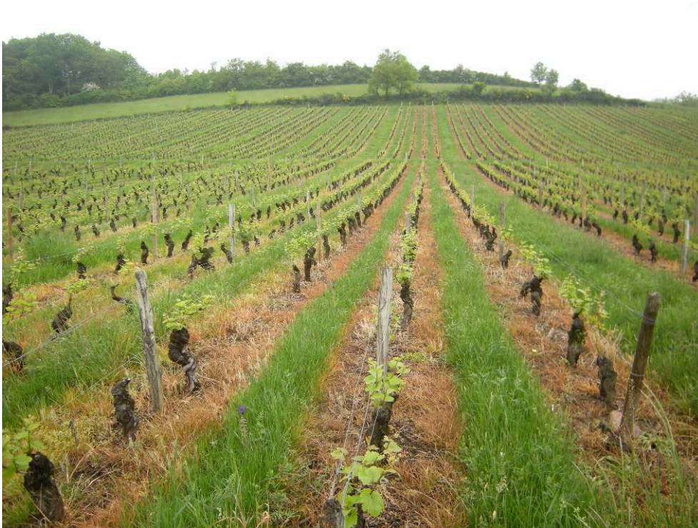
Figure 3. Parcelle restructurée avec enherbement inter-rang

pays membres de l'Union européenne). Le plan proposé s'appuie sur les études de la Sicarex 9 et de la chambre d'agriculture menées depuis dix ans, qui ont conduit à préconiser des orientations techniques validées. Des aides européennes via FranceAgriMer peuvent être accordées aux viticulteurs soit dans un cadre individuel, soit dans un cadre collectif (Plan collectif de restructuration). Le dispositif est prévu pour favoriser le renouvellement du vignoble en respectant des densités moins importantes et en élargissant les rangs de vignes.