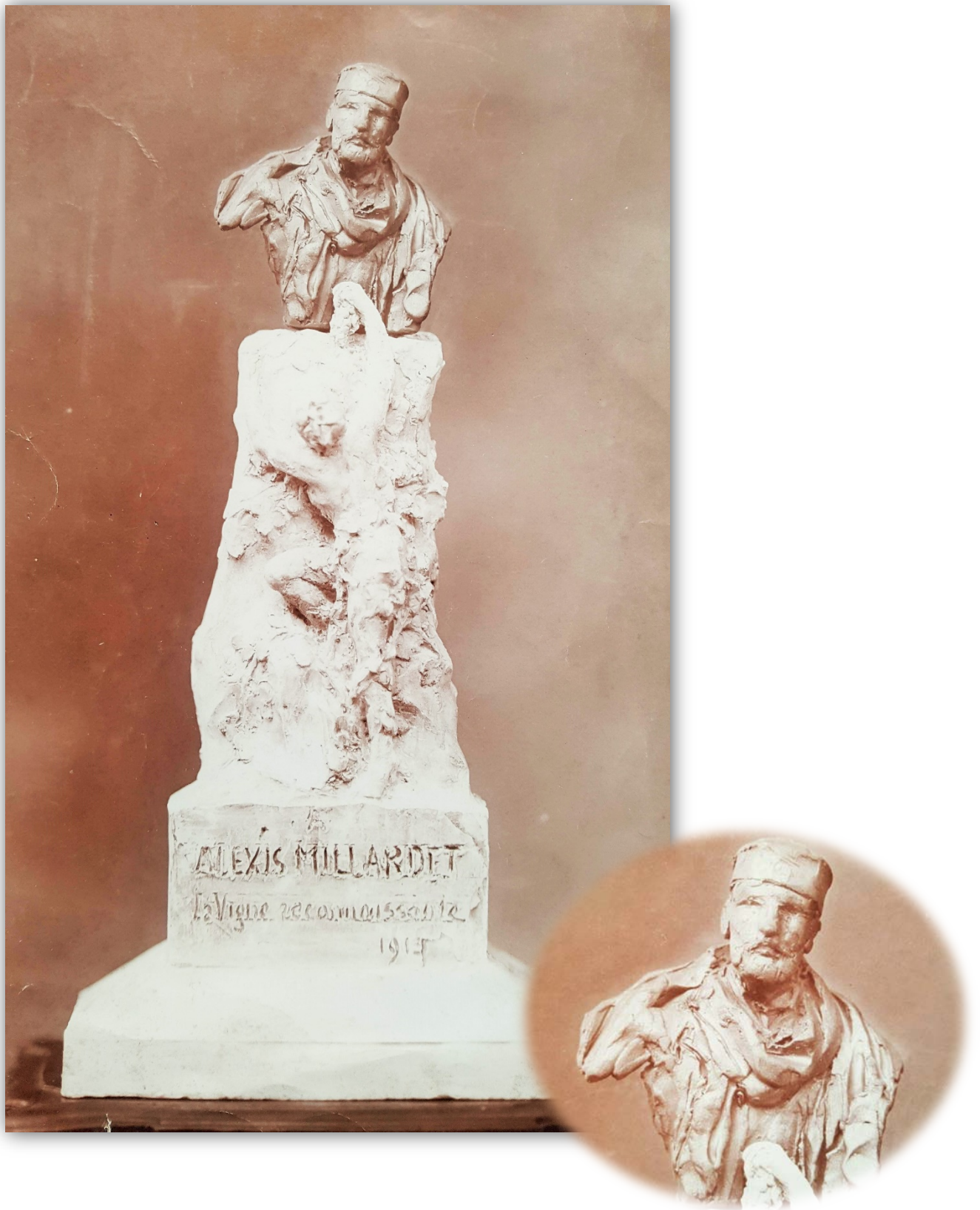
Planche 09 Esquisse pour le Monument à Alexis Millardet : buste et socle