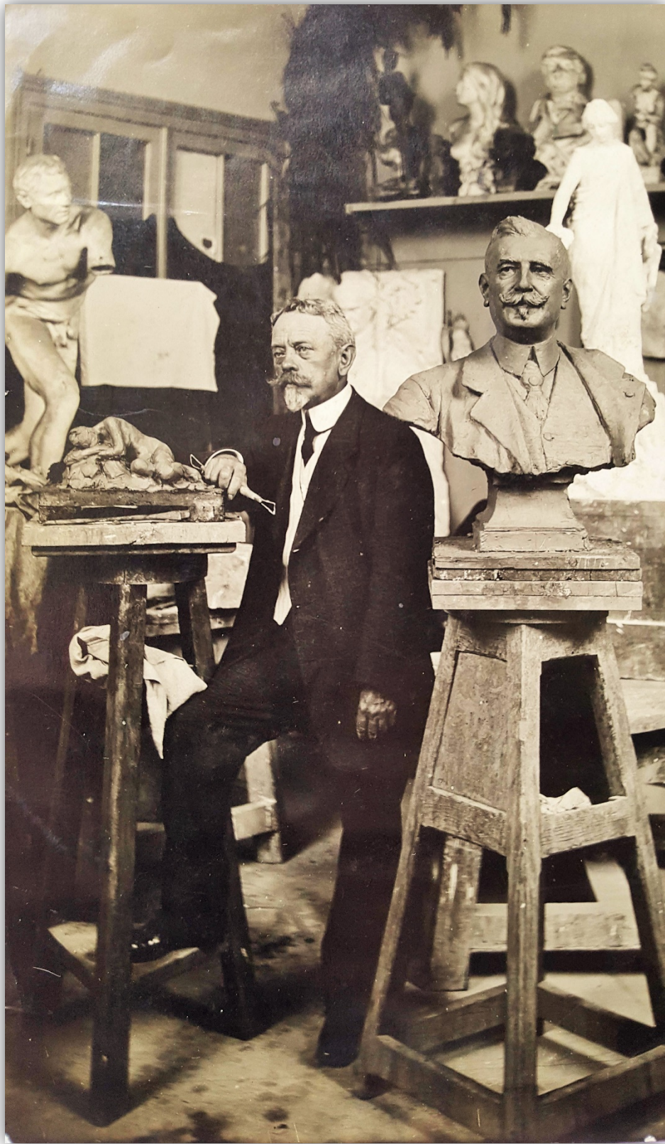
Photographie du sculpteur dans son atelier (près du buste de Charles Cazalet), vers 1912.