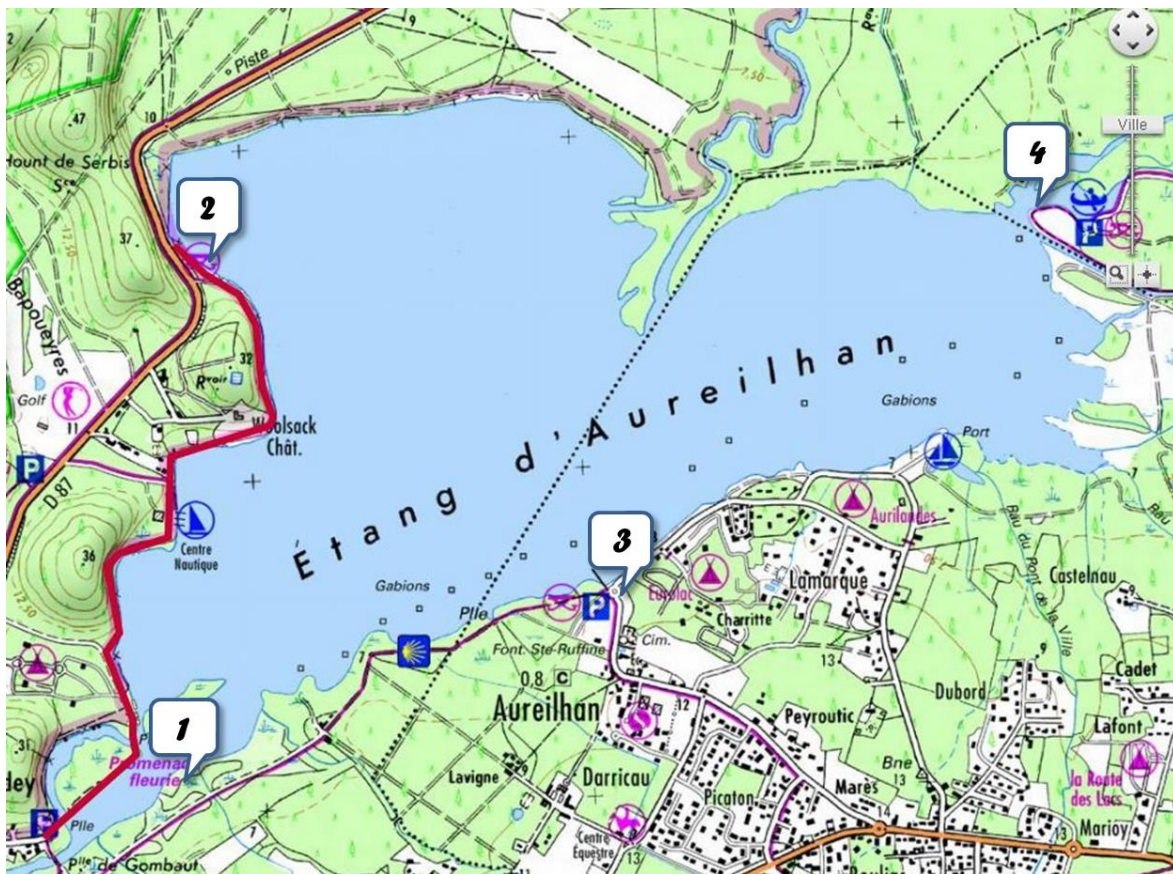
Liste des sites d'enquête : 1.Promenade fleurie, 2.Serbiat, 3.Plage Sud, 4.Anse Saint Paul

Le questionnaire comportait plusieurs parties abordant (pas forcément dans cet ordre) :