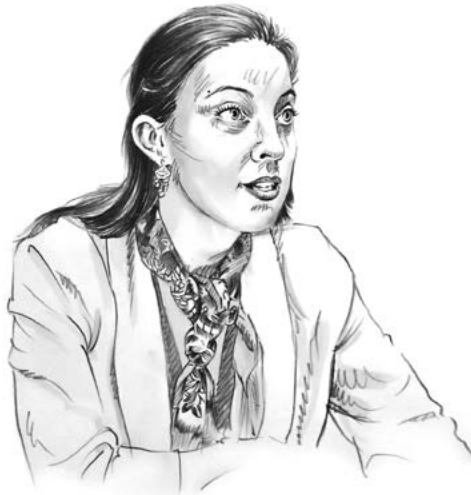
par Agnès Hallosserie, Fondation pour la recherche sur la biodiversité

Les scientifiques qui travaillent depuis des décennies sur cette question, qu'ils soient écologues, sociologues, anthropologues ou encore économistes, unissent leurs voix pour alerter les politiques, mais aussi les collectivités, les entreprises