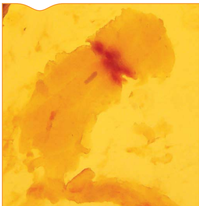
Figure 3. Détection d'une larve plérocercoïde de 4 mm dans un filet de perche sur une table de mirage