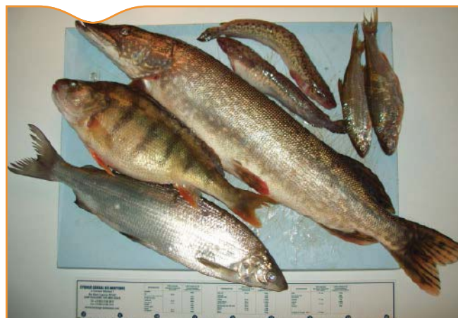
Figure 1. Principaux poissons présents dans le lac Léman (de gauche à droite: corégone (féra ou lavaret), perche, brochet, lottes, gardons). La règle mesure 40 cm

de ce nouvel hôte. L'Homme et d'autres mammifères piscivores se contaminent alors, en ingérant la chair crue ou insuffisamment cuite de ces poissons d'eau douce. Une fois dans l'intestin de l'hôte définitif, la larve plérocercoïde grandit de plusieurs centimètres par jour et les premiers œufs sont émis avec les selles, environ un mois après