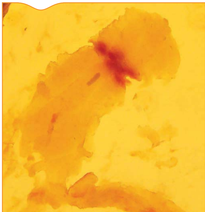
Figure 3. Détection d'une larve plérocercoïde de 4 mm dans un filet de perche sur une table de mirage