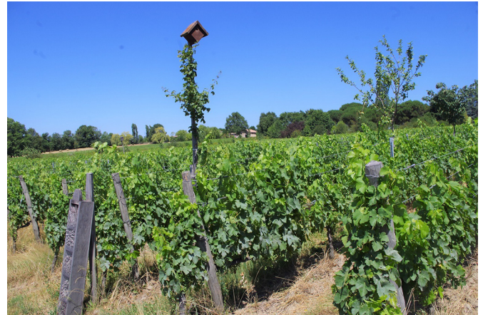
Fig. 2. L'agroforesterie et la biodiversité animale au Domaine Emile Grellier (F. Macary).