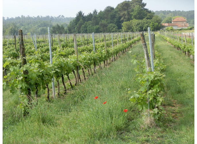
Fig. 5. Biodiversité végétale dans le vignoble (F. Macary).