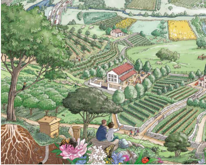
Fig. 3. Illustration d'un paysage viticole type (Lempereur et al. , 2017).