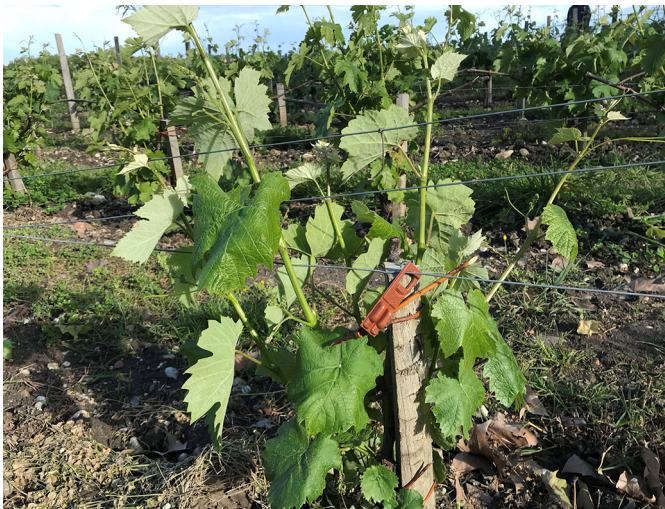
Fig. 4. Capsules de phéromones pour maîtriser les vers de la grappe (F. Macary).