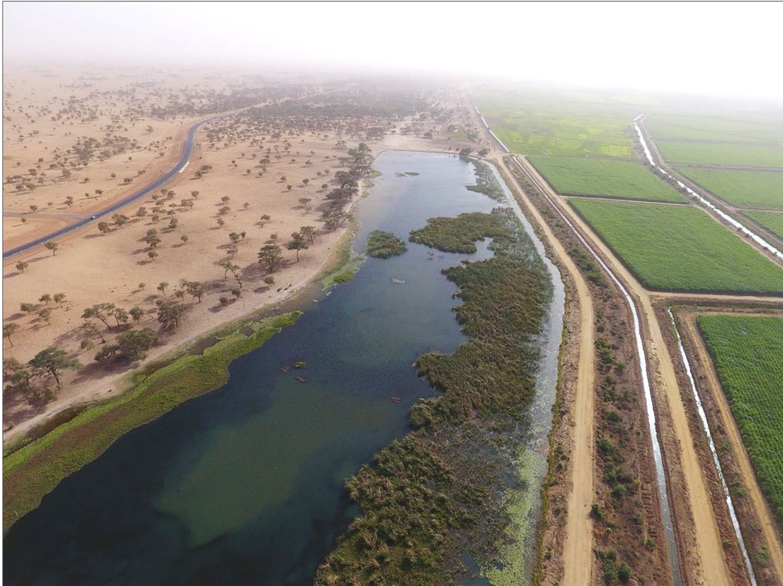
Fig. 1. Mise en évidence de différentes formes de modèles agricoles dans le Delta du fleuve Sénégal. Fig. 1. Highlighting different forms of agricultural models in the Senegal River Delta.

et Jayne et al. (2016), associant l'analyse des modèles d'accumulation de terres et des trajectoires agricoles pour l'étude socio-économique des exploitations agricoles de taille moyenne. Pour examiner les potentielles stratégies d'accumulation et identifier les trajectoires agricoles, nous avons combiné l'analyse des modalités d'accès et d'usage des terres agricoles avec l'identification des pratiques des exploitations agricoles familiales, organisations socio-économiques de base (Benoit-Cattin, 2007). Pour que nos résultats permettent la mise en évidence de profils d'exploitations ayant accumulé des terres, nous avons considéré les exploitations ayant au moins 3 hectares de terres possédées. Ce seuil a été fixé en prenant en compte les statistiques agricoles disponibles, qui estimaient que 69,8 % des exploitations disposent d'un domaine foncier dont la taille est comprise entre 1 à 5 hectares (ANSD, 2014).