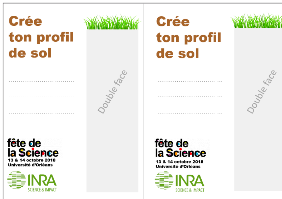
Figure 1 - Model of the cardboard.