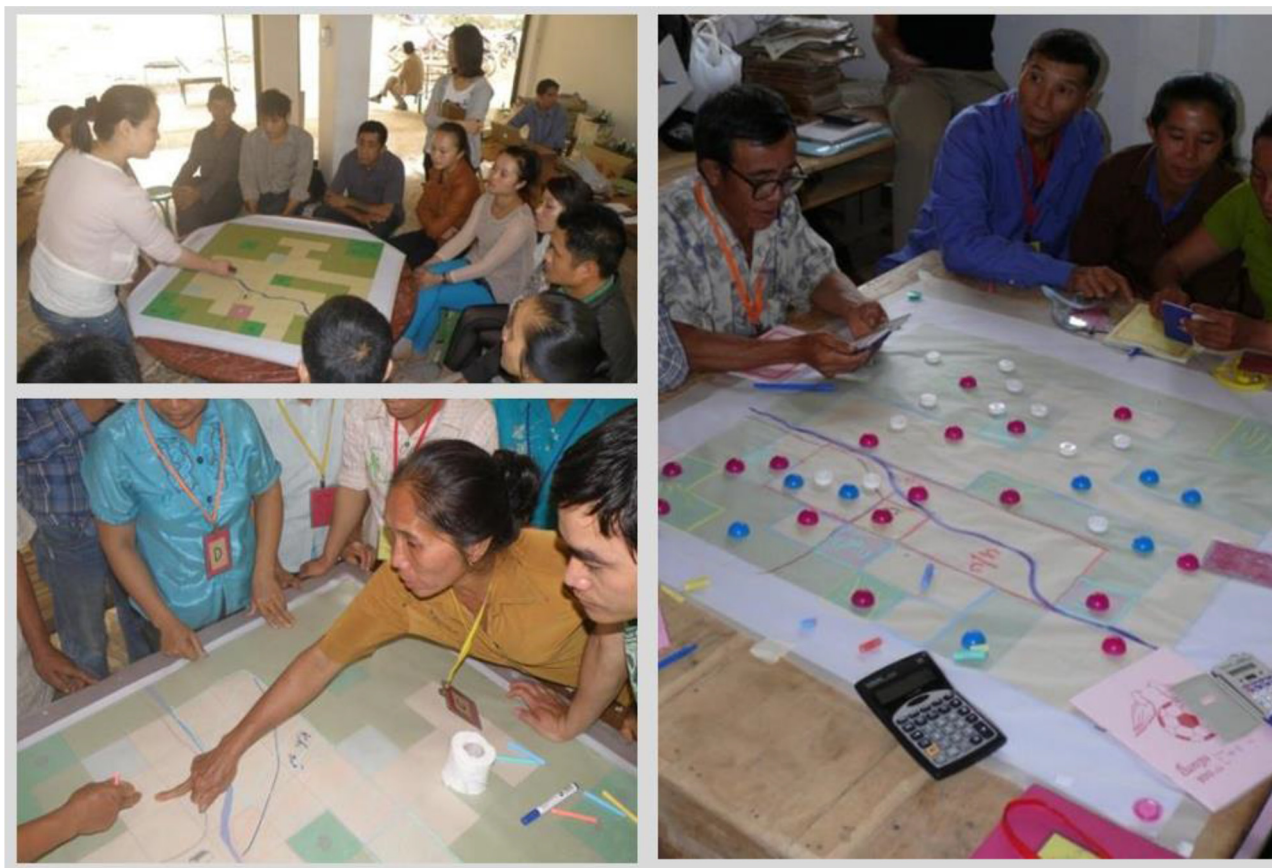
Fig. 4. Jeu de rôle utilisé pour la planification et simulation participative de l'usage des terres.