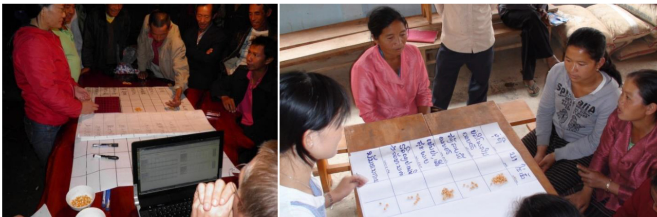
Fig. 2. Ateliers d'évaluation participative des services écosystémiques associés à différents types d'usage des terres. Fig. 2. Participatory workshops on evaluation of ecosystem services associated with different land use types.

forestières sur les moyens d'existence locaux ; et (iii) la plantation d'arbres pour augmenter la biomasse totale du paysage au-delà de la régénération naturelle des aires protégées (Lestrelin et al. , 2013 ; Pham et al. , 2019). Le plan d'aménagement du territoire est la pierre angulaire de la mise en œuvre de la REDD+ car il détermine la répartition spatiale des différents types d'usages des terres, et donc les potentialités du territoire villageois en termes de génération de revenus et de fourniture de services écosystémiques tels que la séquestration du carbone et la préservation de la biodiversité.