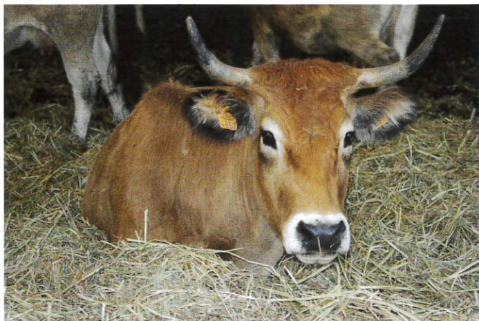
Figure 6 – Vache Maraîchine couchée sur un lit de roseaux

Dans les conditions de réalisation de cette étude, le roseau offre donc une bonne alternative à la paille de céréales . Son coût de revient est d'environ 50 €/tonne (coût de transport sur 10 kilomètres environ entre la roselière et la ferme non compris), ce qui est 50 % moins cher que l'achat de paille (considérant le cours actuel de 100 €/tonne pour la paille ; ce prix peut cependant être plus élevé en période de pénurie et de forte demande). Il est prévu de faire des mesures de composition en éléments minéraux des composts issus de ces trois litières et de leur valeur fertilisante avant de les épandre sur les surfaces cultivées de la ferme expérimentale.