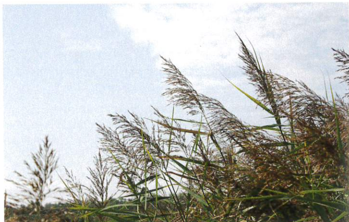
Figure 1 – Le Phragmite ( Phragmites australis ) communément appelé Roseau commun

septembre. Ils l'utilisent ensuite en matelas de matières végétales pour leurs vaches en stabulation (comme substitut à la paille de céréales).