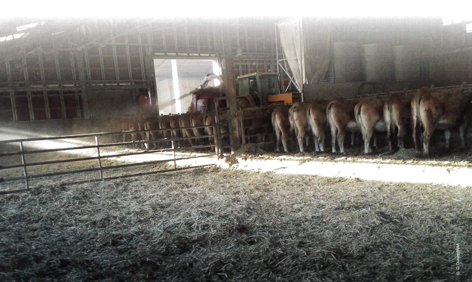
Figure 4 – Paillage des cases lorsque les vaches s'alimentent à l'auge (ici paillage avec du roseau)

Les résultats montrent que la litière est en moyenne à 20 à 25° C (température adéquate pour ce genre de litière). Cette température n'est pas différente d'une case à l'autre donc d'une litière à l'autre. La surveillance de l'état sanitaire des animaux n'a révélé aucune pathologie particulière (dans aucune des cases). L'état de propreté des animaux est légèrement plus satisfaisant avec le roseau qu'avec la paille (voir figure ci-dessous). Ce résultat pourrait s'expliquer, pour la première période d'essai, par l'utilisation d'une paille d'orge assez cassante, mais aussi par quelques artefacts expérimentaux (exemple, salissement plus conséquent de la litière dans la case « paille » du fait de la présence d'eau autour des buvettes d'abreuvement – dû au comportement atypique d'une vache dans ce lot).