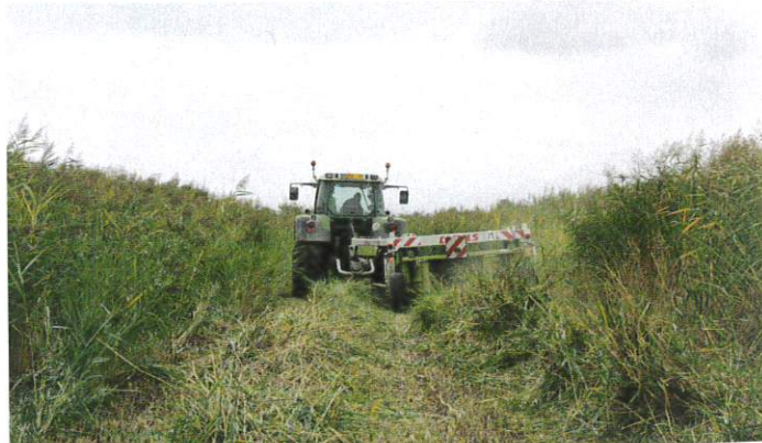
Figure 2 – Fauche de la roselière

Pour les besoins de cette étude, une roselière d'environ 1 hectare a été fauchée le 6 septembre 2018 (à la faucheuse rotative, sans conditionneur). Le roseau ainsi coupé a été mis en andain et laissé à sécher une semaine au soleil. Le bottelage a ensuite eu lieu le 13 septembre avec un round baller (avec rotocut) : 20 tonnes de roseau (soit 53 balles) ont été récoltées pour les essais en stabulation.