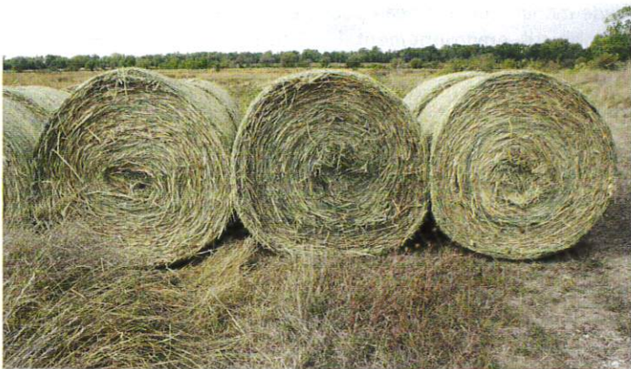
Figure 3 – Balles de roseau (©D. Durant/INRA)