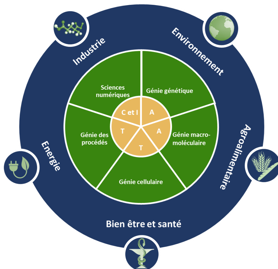
Figure 3 - Le multi-positionnement d'IBISBA. L'infrastructure IBISBA situe son activité dans l'ingénierie biologique et décline ses services selon le cycle CATI (Concevoir, Assembler, Tester, Intégrer ou DBTL en anglais). Les domaines d'application des services d'IBISBA couvrent les applications industrielles et environnementale, l'agroalimentaire, le secteur du bien-être, les produits pharmaceutiques et le secteur de l'énergie. Cette figure est adaptée du rapport Engineering Biology: A Research Roadmap for the Next-Generation Bioeconomy . DOI: 10.25498/E4159B

La vocation première d'IBISBA est d'accélérer la traduction de résultats et de connaissances fondamentales en concepts et prototypes dont la maturité est suffisante pour leur transfert vers la sphère industrielle.