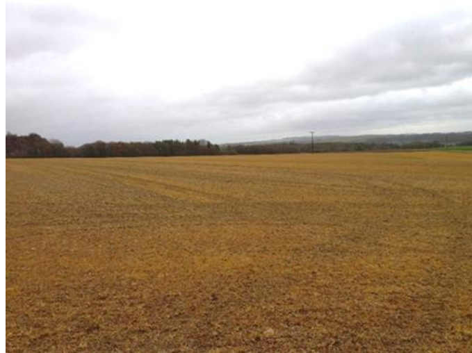
Figure 2 : Parcelle en interculture avant semis d'une céréale et traitée au glyphosate

Après 20 ans d'utilisation, aucun cas de résistance n'avait encore été observé. Cependant, en 1996, des populations d'ivraie raide ( Lolium rigidum ) résistantes au glyphosate ont été identifiées en Australie (Powles et al., 1998). D'autres cas de résistances ont été recensés dans des cultures génétiquement modifiées tolérantes au glyphosate (Bonny, 2016). En France, les premiers cas de résistance ont été observés en vigne en 2005 chez l'ivraie raide (Favier et Gauvrit, 2007) et l'érigéron de Sumatra ( Conyza sumatrensis ; Dubois et al., 2011).