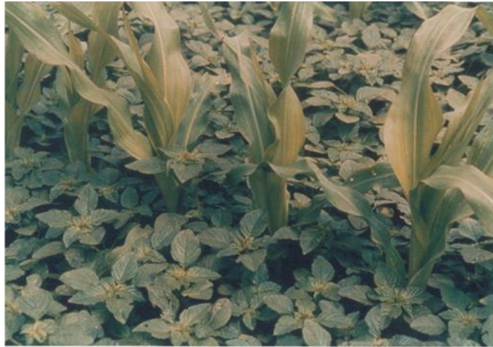
Figure 1 : Parcelle de maïs envahie d'amarantes résistantes à l'atrazine

Les premières populations résistantes aux triazines ont été découvertes aux États-Unis en 1968 chez le séneçon commun ( Senecio vulgaris ; Ryan, 1970). En France, une première détection de résistance en 1978 (Ducruet et Gasquez, 1978 ; Figure 1) et une augmentation des problématiques de résistance les années suivantes, ont incité les ingénieurs conseil à proposer des programmes adaptés, sans pour autant préconiser un abandon de cette molécule, du fait de sa bonne efficacité globale (AGPM et ITCF, 1989).