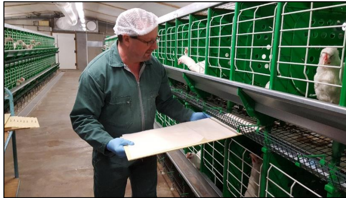
Figure 3. Mise en place d'un plateau de recueil de fientes sous la cage des poules adultes (S. Baucheron)

L'ensemble des matériels ont été lavé à l'eau chaude avec un nettoyeur haute pression puis désinfecté à l'aide d'un produit agréé pour l'élevage, par trempage pour les seaux et par pulvérisation pour les plateaux et containers.