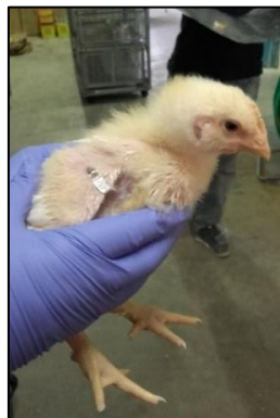
Figure 4. Lecture de la bague d'un poussin de trois semaines d'âge (S. Baucheron)

Les seaux désinfectés ont été disposés à même le sol de la zone de prélèvement et les animaliers responsables du bâtiment d'élevage ont déposé dans chacun d'eux un poussin préalablement choisi pour le projet (Figure 1). A compter de ce moment, a commencé la surveillance individuelle pour retirer l'animal dès l'instant que les fientes ont été produites, afin d'éviter qu'il ne les souille en marchant dessus. Afin de prévenir des erreurs possibles de correspondance animal / fientes, il est indispensable au moment du retrait du poussin de prendre également la feuille d'aluminium contenant ses fientes et de lire sa bague d'identification (Figure 4). La feuille d'aluminium contenant les fientes a aussitôt été confiée au préleveur qui suivait la méthode d'échantillonnage décrite dans la partie suivante.