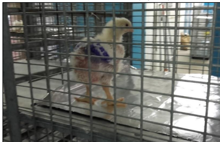
Figure 2. Poussin de trois semaines d'âge déposé sur papier aluminium en container (S. Baucheron)