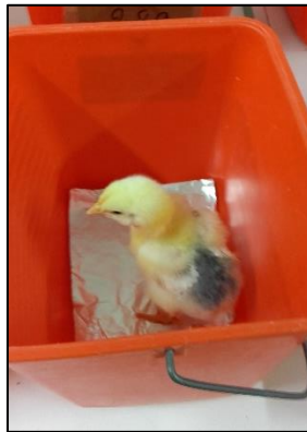
Figure 1. Poussin d'une semaine d'âge déposé sur papier aluminium stérile en seau