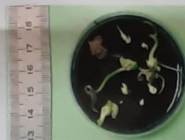
Boîte de pétri avec embryons et plantules

Après fécondation dirigée, les embryons sont extraits de la graine et déposés sur milieu nutritif gélosé. Des plantules sont régénérées. Les qualités de la descendance seront étudiées (résistance à l'anthracnose, rendement, goût, etc...)