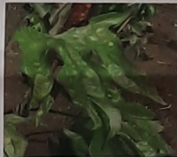
Symptômes de virose sur feuilles

Chez les ignames, une maladie virale principalement due au YMV (Yam Mosaic virus) entraîne une diminution drastique du rendement. L'utilisation pour la plantation de tubercules virosés contribue fortement à la dissémination du virus.