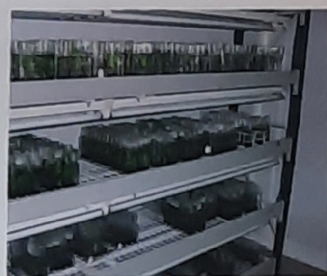
Salle de culture