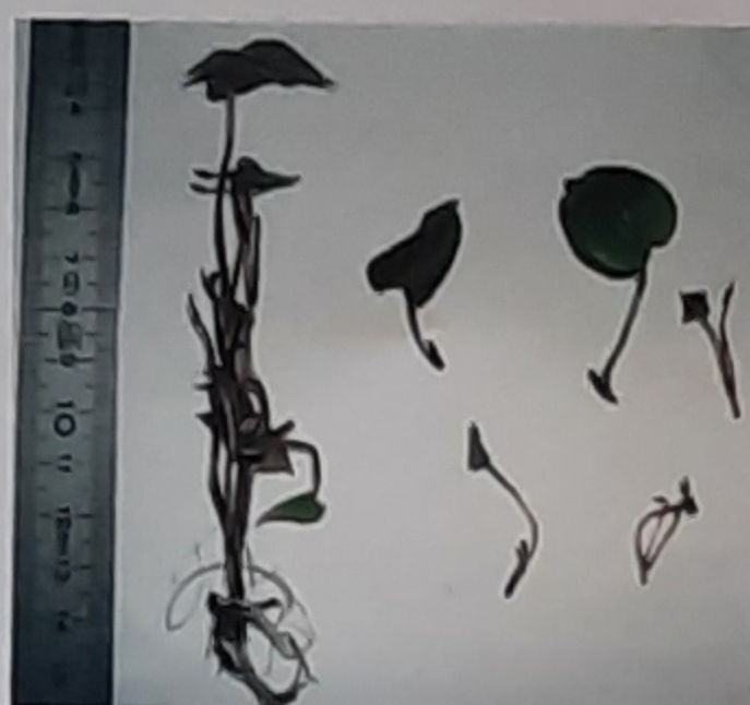
Vitroplant avant fragmentation et boutures obtenues

La multiplication conforme conserve les caractères initiaux de la variété et consiste en des microbouturages d'explants. Sur une plantule, on peut obtenir à intervalles réguliers, autant de boutures qu'il y a de nœuds.