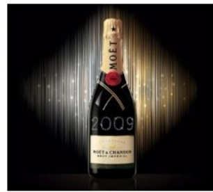
Campagne internationale versus campagne française