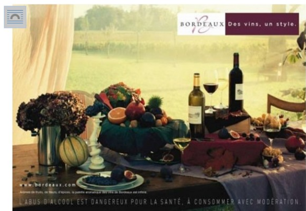
Campagne internationale versus campagne française