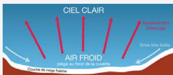
Figure 2 • Schéma de l'écoulement de vent catabatique.

Si le ciel est clair, rien ne retient le rayonnement du sol, celui-ci est alors dispersé dans les plus hautes couches de l'atmosphère et réchauffe l'air en altitude : une inversion thermique peut alors se former. Au contraire, si le ciel est nuageux une partie des rayonnements est renvoyé vers le sol et limite l'effet de l'inversion thermique.