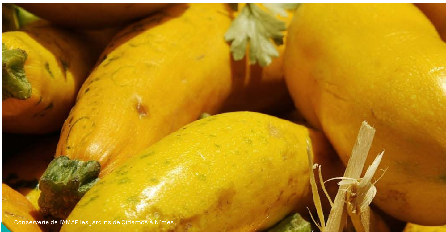
Conserverie de l'AMAP les jardins de Cidamos à Nîmes