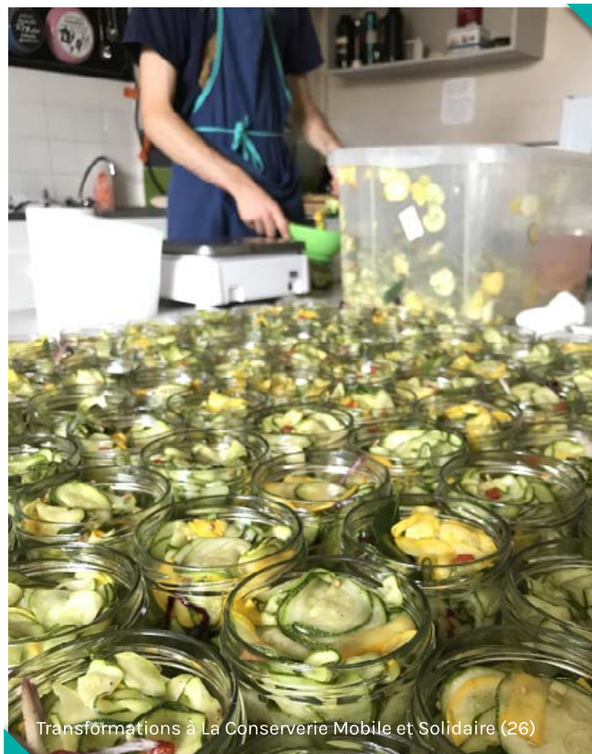
Transformations à La Conserverie Mobile et Solidaire (26)

A noter qu'au-delà de l'autoclave, les gérants d'un atelier doivent penser à la maintenance de tous leurs matériels. Pour la gérante du Local en Bocal (84), « c'est un poste à ne pas négliger ! ». Elle dispose de techniciens maintenance : « un généraliste, pour toutes pannes et sauvetages, et des spécifiques pour certaines machines ».