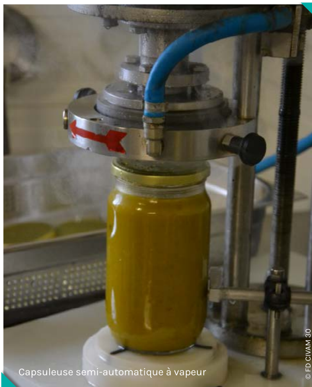
Capsuleuse semi-automatique à vapeur

Un autre type d'atelier de transformation qui se développe est celui d'atelier contribuant à l'insertion par l'activité économique. L'activité devient un support d'insertion professionnelle pour des publics éloignés de l'emploi qui seront formés aux différentes tâches liées à la transformation alimentaire (laver les produits, peler, découper...) : « l'activité de transformation permet aux personnes de prendre confiance en elles et de mieux s'insérer dans la société » selon le porteur de J'aime Boc'oh (73), interrogé lors de l'étude. Ces ateliers peuvent