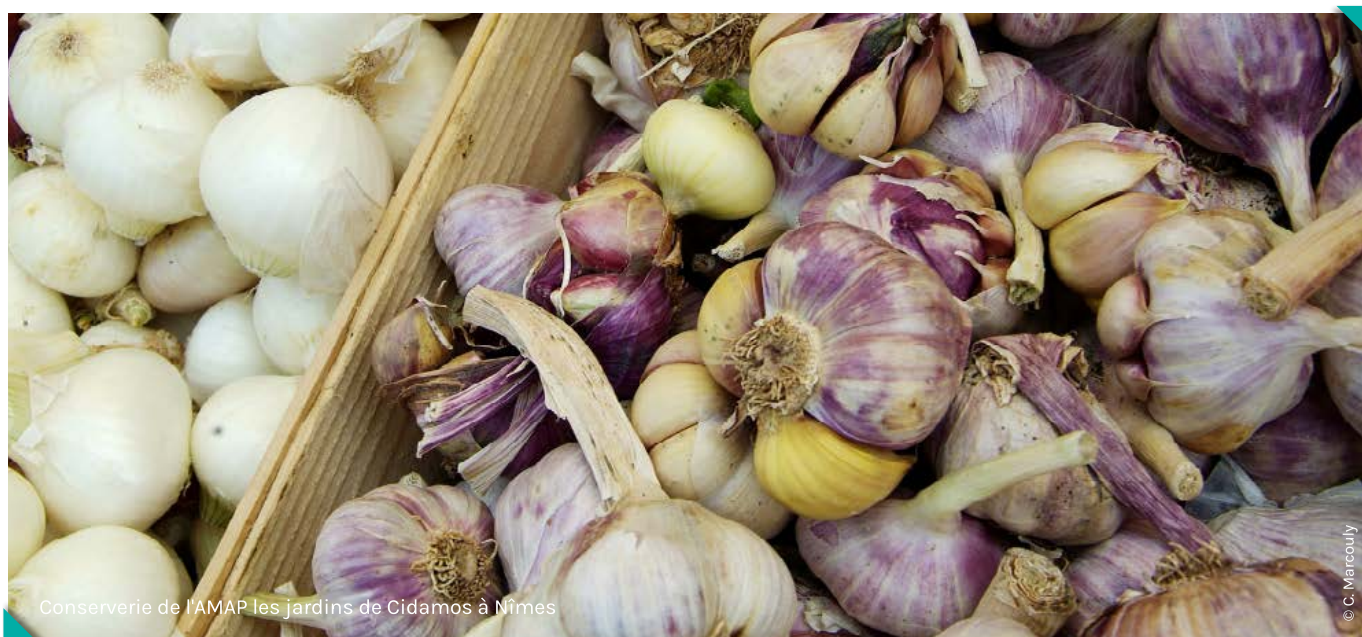
Conserverie de l'AMAP les jardins de Cidamos à Nîmes

Dans le tableau 1 en page suivante, nous présentons de façon anonymisée les principaux investissements qui nous ont été rapportés lors de nos entretiens, ainsi que le coût estimatif et les caractéristiques techniques du matériel, lorsque l'information nous a été fournie. Il faut savoir que le poids des investissements impactera le montant des dotations aux amortissements qui seront ventilées sur les différents produits (selon une clé de répartition à définir). Plus les volumes produits seront importants, plus la part des dotations aux amortissements dans le coût unitaire du produit sera moindre. D'où l'importance de bien raisonner le dimensionnement initial du matériel.