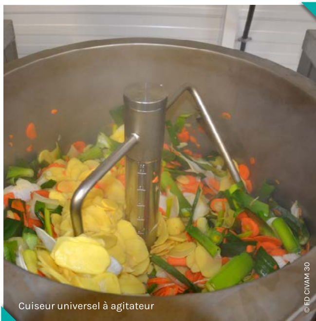
Cuiseur universel à agitateur

Pour choisir sa gamme de produits finis, plusieurs paramètres peuvent être intégrés : la nature et la disponibilité des matières premières présentes en local, mais aussi leur coût, les idées recettes des producteurs (dans le cas du travail à façon), les choix d'investissement en matériel (autoclave, presse/embouteilleuse à jus/autre), les choix de procédés technologiques, les échanges avec les consommateurs finaux sur le goût, et la complexité de réalisation de la recette (en termes de préparation et de définition du barème de stérilisation). A mesure de la montée en compétences, la gamme de l'atelier peut intégrer des recettes plus complexes et des produits plus diversifiés (coulis, soupes, houmous, compotes, produits séchés...). La co-construction des recettes et la dégustation des produits avec des panels de consommateurs et responsables de magasin peut être une démarche utile pour s'assurer que les produits trouveront des débouchés sur le marché. La Conserverie Locale à Metz (57) témoigne de son expérience : « Nous essayons d'élaborer de nouvelles recettes innovantes, en lien avec les producteurs avec qui nous travaillons. Nous cherchons à diversifier nos gammes pour éviter les concurrences. Les nouveautés remportent souvent un franc succès (ketchup, tartinades, etc.) ».