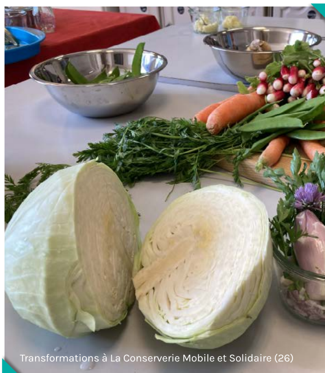
Transformations à La Conserverie Mobile et Solidaire (26)

A noter que contrairement à ce qu'on aurait tendance à penser, la transformation ne peut pas s'adresser à tout type d'invendu. Par exemple, si les tomates cœur de bœuf sont très intéressantes fraîches, d'un point de vue gustatif, leur rendement en coulis est faible du fait de leur haute teneur en eau. Les tomates roma seront donc à privilégier et certains producteurs iront jusqu'à les produire spécifiquement pour la transformation (afin de proposer des coulis dans les paniers de leurs consommateurs, par exemple). Il ne s'agit donc pas d'envisager la transformation seulement comme une alternative au surplus et au gaspillage.