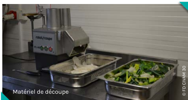
Matériel de découpe

Ces combinaisons de produits/services et débouchés sont données à titre d'exemples. Il s'agit de cas fréquents, mais évidemment chaque porteur est libre de concevoir ses offres pour toucher les cibles pertinentes (ex. : prestations traiteur, prestations légerie pour la restauration collective, formations, ateliers pédagogiques, ateliers solidaires, autres animations de territoire) et ainsi renforcer son modèle économique. Cela relève de la stratégie du ou des gérants de chaque atelier. C'est ce que fait la Conserverie Mobile et Solidaire (26) qui propose de la formation et de la location de matériel, mais aussi de la transformation à façon, ainsi que des animations "conserve festive" et de la restauration avec le foodtruck à destination du grand public.