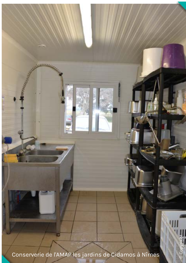
Conserverie de l'AMAP les jardins de Cidamos à Nîmes

Nous n'avons pas analysé, dans le cadre de notre étude, la gouvernance d'ateliers de transformation impliquant une multiplicité d'acteurs (de type SCIC avec collègues agriculteurs, citoyens consommateurs, structures sociales, détaillants, collectivités). Ce sera l'objet d'explorations futures.