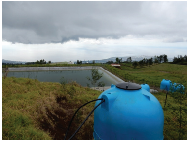
Illustration 1 Retenue collinaire dans les Hauts de Saint-Paul