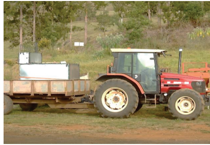
Illustration 2 Équipement d'un agriculteur des Hauts de Saint-Paul pour alimenter en eau potable son élevage et son habitation