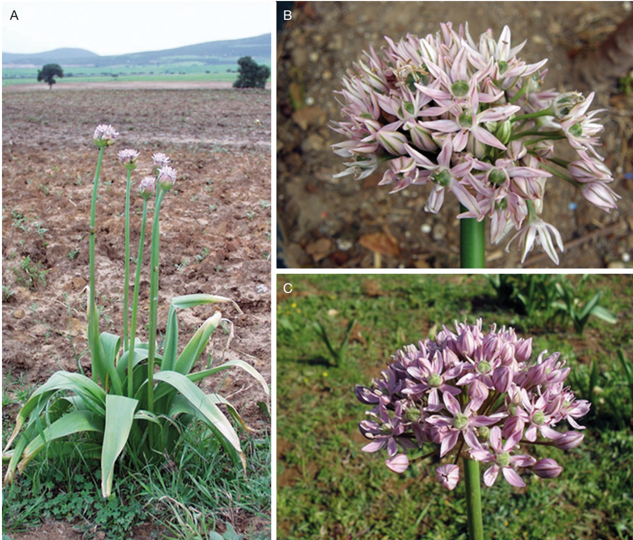
FIG. 4. — A , Allium nigrum L. en Numidie littorale (NE-Algérie). 15 avril 2003; B , Allium nigrum en Kabylie (N-Algérie). 9 avril 2010; C , Allium nigrum dans les Monts de Tlemcen (NW-Algérie). 27 avril 2011.

entre Oued Zoughli et Aïn Charchara, R.N. 74 Beni Ourtilane/Hammam Guergour, 36^{\circ}23'46''\text{N} , 4^{\circ}56'14''\text{E} , alt. 740 m, 11.IV.2014, E. Véla (Fig. 3); à la sortie d'Aïn Roua vers Béjaïa, 36^{\circ}21'00''\text{N} , 5^{\circ}14'15''\text{E} , alt. 820 m, 30.V.2014; Douar Ouled M'hamed (Djebel Anini), 36^{\circ}19'01''\text{N} , 5^{\circ}13'26''\text{E} , alt. 1182 m, 30.V.2014 (en phase de fructification), K. Rebbas. — Wilaya de Bordj Bou Arreridj, Djebel Maadid versant nord, en amont de village Ghafsitaine, alt. 1049 m, 35^{\circ}53'42''\text{N} , 04^{\circ}43'22''\text{E} , 3.VII.2018, K. Rebbas; Aïn Loulou, 35^{\circ}53'23''\text{N} , 04^{\circ}45'44''\text{E} , alt. 1281 m, K. Rebbas; Douar Ouled Aïssa, 35^{\circ}53'20''\text{N} , 04^{\circ}46'33''\text{E} , alt. 1394 m, 3.VII.2018 (en phase de fructification), K. Rebbas.