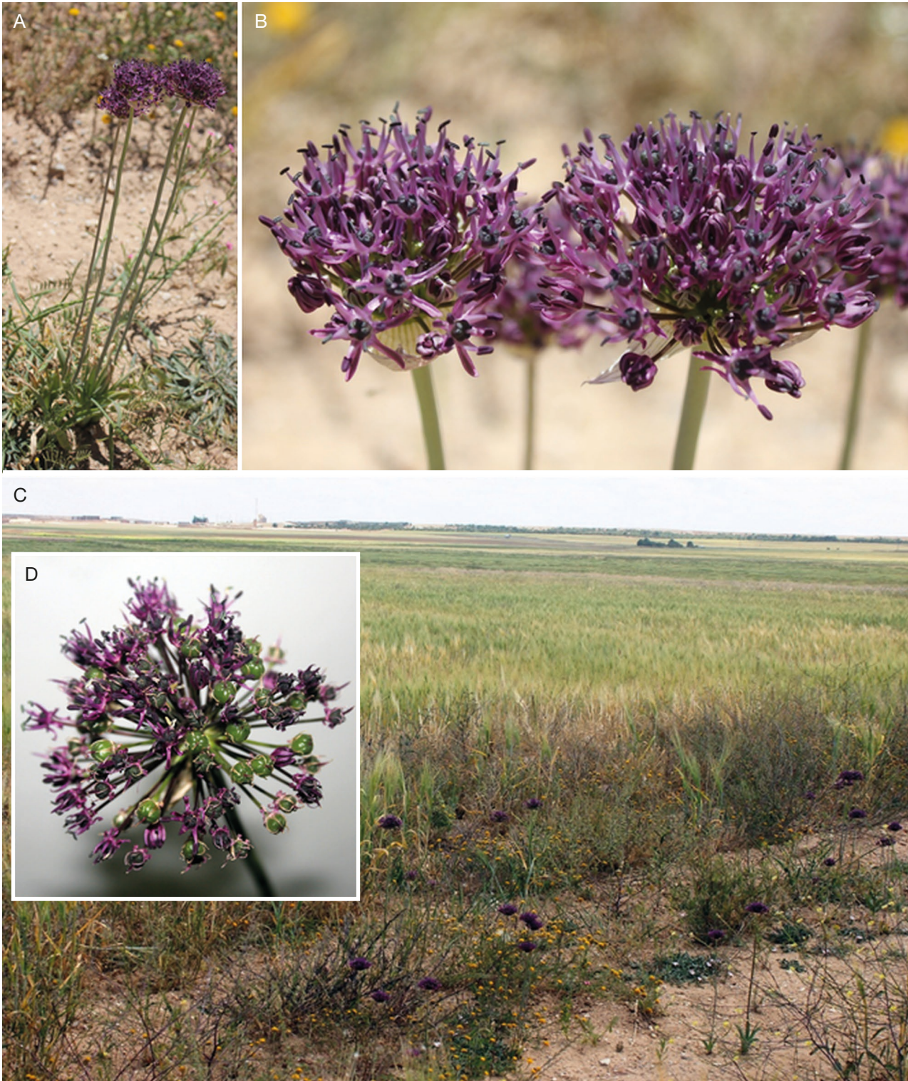
FIG. 2. — Allium cyrilli Ten., forme sombre dans les Hauts-Plaines au sud de Tlemcen (NW-Algérie). Photos K. Moulay-Meliani, 11 mai 2013 (A, B) et 20 mai 2013 (C, D).

SPÉCIMENS CONSULTÉS DU SECTEUR EUROPE (EUR). — Grèce. Inter segetes Atticae , 18-- [19 e siècle], Wolff [sub. « Allium magicum L.»], Herb. E. Cosson/herb. Al. de Bunge, P(P01845117 gauche); Scio [Chios], Olivier et Bruguère [sub. « Allium nigrum L.»], Herb. Mus. Paris, P(P01850818).