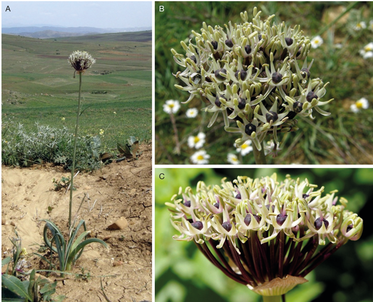
FIG. 1. — Allium cyrilli Ten., forme claire dans l'ouest des Monts du Hodna (N-Algérie). Photos K. Rebbas, 28 avril 2011 (A, B) et 19 mai 2013 (C).

rapidement réfractés dès l'anthèse. Les filets staminaux sont de forme longuement triangulaire et portent des anthères qui dépassent légèrement les tépales à l'ouverture. L'ovaire est court, tronqué et trilobé. Le style égale environ l'ovaire. Il existe deux variants chromatiques, apparemment sans intermédiaires. Chez la forme sombre, les tépales, les filets staminaux et le style sont violet-pourpre, les anthères et l'ovaire pourpre noirâtre. Chez la forme claire, les tépales, les filets staminaux et le style sont blanc verdâtre, les anthères jaune verdâtre, mais l'ovaire conserve sa couleur pourpre noirâtre. Les pédicelles égalent 3 à 4 fois les tépales, sont toujours brun-pourpre à l'anthèse, y compris chez la forme claire, et verdissent à la fructification. La spathe est papyracée, blanchâtre, nettement nervurée de vert-brunâtre. Les scapes sont d'un vert glauque ou plus ou moins brunâtre, hauts de 30 à 70 cm. Les feuilles, toutes basales, sont au nombre de 3-6, longues d'environ 10 à 40 cm, larges d'environ 10 à 25 mm, récurvées, généralement en partie marcescentes à l'anthèse. Il n'existe pas de bulbille aérienne. Le bulbe, blanc, mesure 1,5 à 2,5 cm et émet des stolons bulbillifères. La phénologie, identique pour les deux formes, est centrée sur la fin avril et le mois de mai.