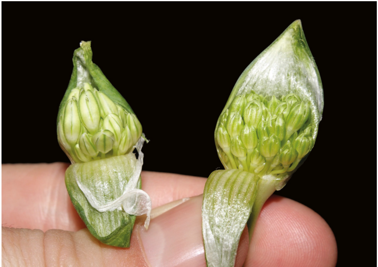
FIG. 3. — Allium nigrum (à gauche) et Allium cyrilli (à droite) en boutons, provenant respectivement des environs de Hammam Guergour et de Sétif (NE-Algérie). Photo E. Véla, 12.IV.2014.