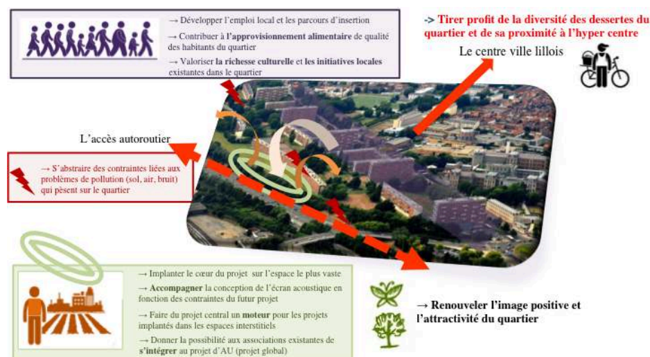
Figure 3- Carte des enjeux du secteur Concorde au vue d'installer un projet d'AU.