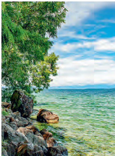
Une publication du Centre de la Nature Montagnarde