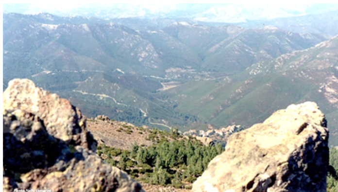
Figure 5 : Un territoire d'estive utilisé par les caprins, Noceta, (Photo N. Lazzarini).

des chèvres de race alpine, Saanen ou Anglo-nubiennes sur des systèmes non pastoraux mais il n'existe à ce jour aucun registre fiable sur le nombre d'élevages de ce type en activité. De plus, un grand nombre d'éleveurs possède quelques animaux de race non Corse ou croisés dans leur troupeau.