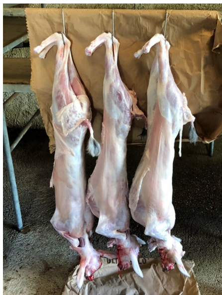
Figure 10 : Présentation du produit tel qu'il est commercialisé en région ajaccienne: pattes arrières repliées, pattes avant insérées dans le cou, couverture avec la crépine et touffe de poils à l'extrémité de la queue. (Photo INRA Limongi).

On observe un délitement des usages de consommation, le cabri étant souvent remplacé à la Noël par la dinde ou le chapon. Certains chevriers souhaitent relancer ce produit par une action collective d'ensemble visant à le protéger par un signe d'origine (Bordeaux et al., 2008). Toutefois, le maintien de l'abattage à la ferme pour 75 % des cabris vendus confine pour le moment ce produit sur des marchés informels.