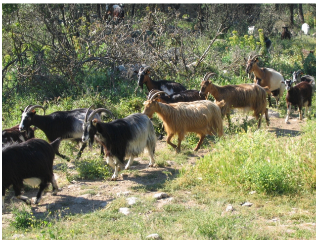
Figure 3 : Un troupeau pastoral de chèvres de race corse. (photo INRA R. Bouche).

Ce genre d'exploration par des troupeaux sans gardiennage continu était déjà connu dans l'antiquité par Diodore de Sicile qui écrit dès le premier siècle avant Jésus Christ: "Les propriétaires ne perdent jamais leurs troupeaux marqués par des signes distinctifs, lors même que personne ne les garde". Ce marquage aux oreilles est appelé u segnu et a fait l'objet de travaux d'ethnologie (op.cit.) et de