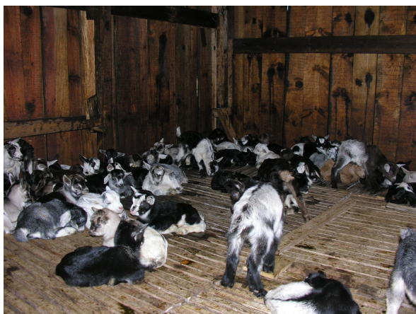
Figure 9 : Cabris maintenus dans la chèvrerie (u chjostru) durant la journée.

Elle était mise à macérer dans du vin avec sel, poivre, piment en poudre, laurier, thym de montagne (arba barona), romarin, le tout mélangé avec du pain sec râpé. Ces lanières étaient ensuite séchées à l'air. Elles étaient enfin enveloppées dans un linge et conservées au frais. La misgiccia se mangeait grillée à la façon du porc salé" (Mercury, op.cit.). Certaines traditions rapportent également l'usage de vinaigre en cuisson acide, et la sèche par boucanage (Ceccaldi, 1968).