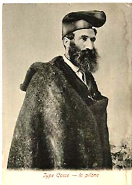
Figures 11 et 12 : Jaquette et vestons en peaux de chèvres corses et Berger vêtu du pilone en poils de chèvre, (Photos extraites de "La vie au grand air", Paris, 1898).