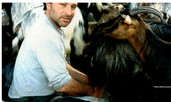
Figure 8 : Traite manuelle d'un troupeau de chèvres corses, (Photo N. Lazzarini).