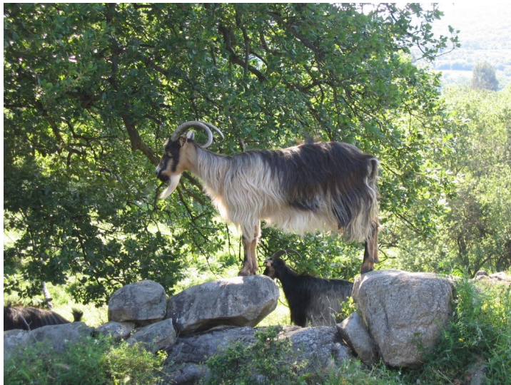
Figure 2 : chèvre de race Corse, (INRA Bouche R).

la tête est fine avec de petites oreilles, et généralement cornue avec des pampilles fréquentes. (Figure 2). La mamelle est accrochée assez haut et se prête bien à la traite manuelle. La reconnaissance officielle par le Centre national d'Analyse Génomique (CNAG) de Barcelone (Espagne) est intervenue le 13 juin 2003.