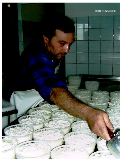
Figure 7 : Fabrication de Casgiu Venachese, (Photo N. Lazzarini).