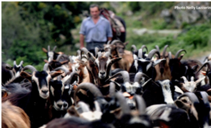
Figure 4 : La conduite du troupeau vers l'estive.

de litres seulement. Cette pratique est d'ailleurs en baisse et moins répandue (environ 30 000 l) que dans le cas du lait de brebis (environ 2 millions de litres). Il demeure difficile de disposer de chiffres précis sur cette activité dont le manque de transparence alimente des polémiques locales.