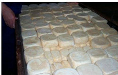
Figures 6a et 6b : Le Calinzanincu, un fromage souvent fabriqué avec du lait de chèvre, (Photo INRA J.-M. Sorba).