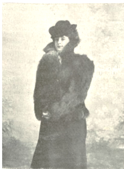
Mod. Ström et fils.) FIGURE 2. JAQUETTE-VESTON EN CHÈVRE CORSE.