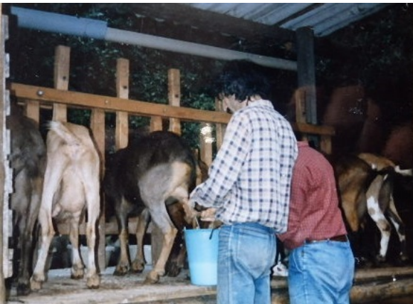
Figure 2 : Luxe apprécié : quai de traite en plein air, dans le Var en 1983.

Leur arrivée en masse a été décisive pour le devenir des territoires d'arrière-pays et des massifs du sud. Arrivés sans ressources (Figure 2), l'accès à la terre a été facilité par le peu de valeur de celle-ci. La chèvre leur permet d'obtenir un produit de leur travail (le lait), de le transformer en fromage et de le vendre à des consommateurs habitués aux fromages de chèvre. A l'époque, l'absence de normes de fromagerie leur a permis de créer l'activité avec peu d'investissements. Comme il est dit dans les articles sur Cévennes et PACA, certains d'entre eux, devenus des leaders professionnels, ont contribué à faire reconnaître la profession et la réalité du pastoralisme, ou encore de la production fermière au lait cru.