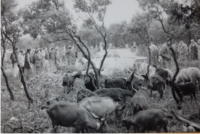
Figure 3 : Forestiers, pastoralistes, chercheurs et éleveurs échantent en situation sur un pare-feu du Gard en 1990, (© M. Napoleone).

entre l'élevage pastoral et l'entretien du territoire. Une coopération entre éleveurs, organisations professionnelles, pastoralistes et chercheurs se met en place pour acquérir des références et des connaissances sur ces systèmes et étudier les verrous à leur développement (Figure 3). Des dérogations, à titre expérimental, sont accordées à des éleveurs caprins en zone forestière soumise. Dépassant le stade de l'expérimentation, des élus mettent à disposition des espaces pastoraux communaux pour faciliter l'installation d'éleveurs.