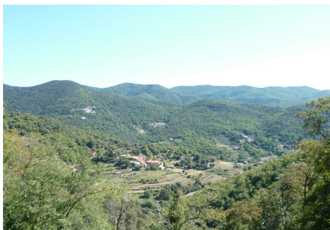
Figure 1 : Paysage de piémont, (© M. Napoléone).

Ces régions présentent des contrastes marqués entre les plaines et l'arrière-pays. Les plaines de grande culture sont fortement urbanisées. Elles concentrent les infrastructures et le développement industriel. La pression foncière y est très forte. Dans l'arrière-pays, distinguons d'une part le piémont, caractérisé par des mosaïques paysagères composées d'espaces naturels ou semi-naturels et de cultures ; et d'autre part des massifs boisés. Ces deux types de territoires sont peu peuplés, souvent enclavés (Figure 1). Ils présentent une