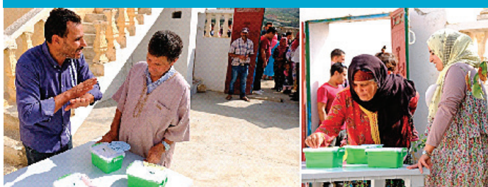
❸ Vote sur les enjeux territoriaux dans la zone de Kairouan.