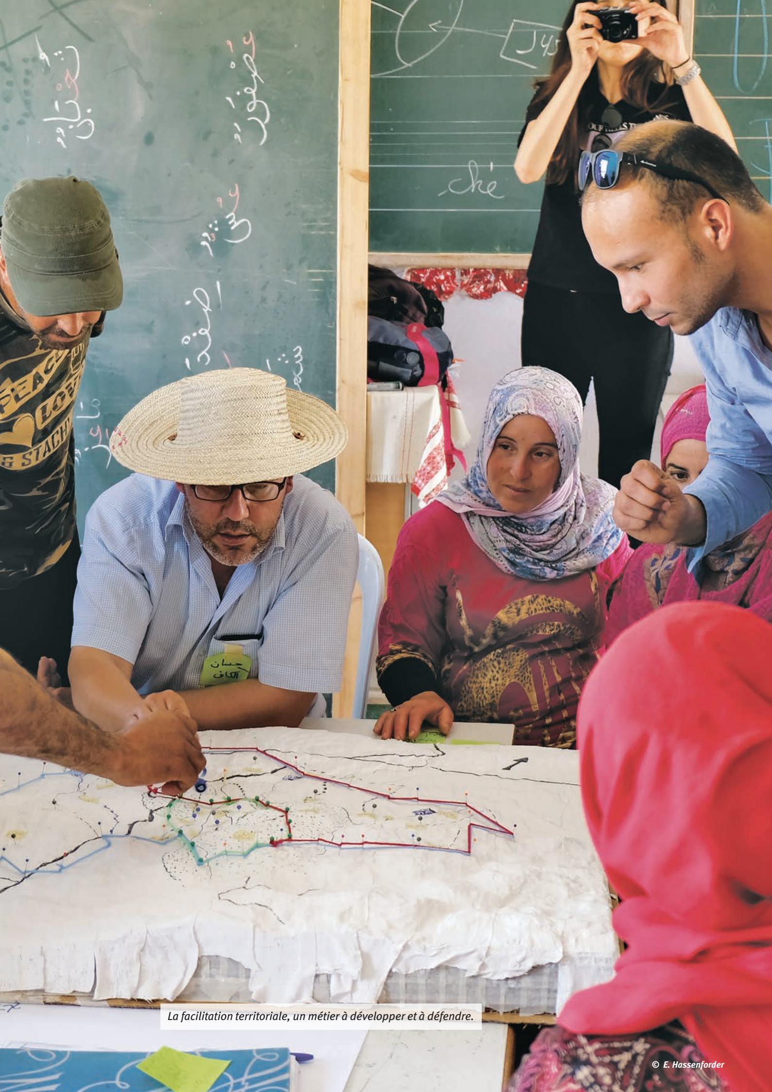
La facilitation territoriale, un métier à développer et à défendre.