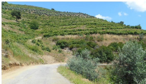
Figura 2 – Exemplicação de IEs conjugadas à vinha. Mostra a vegetação associada, tanto nos taludes, quanto nas entrelinhas de cultivo. Foto das autoras, 2018.