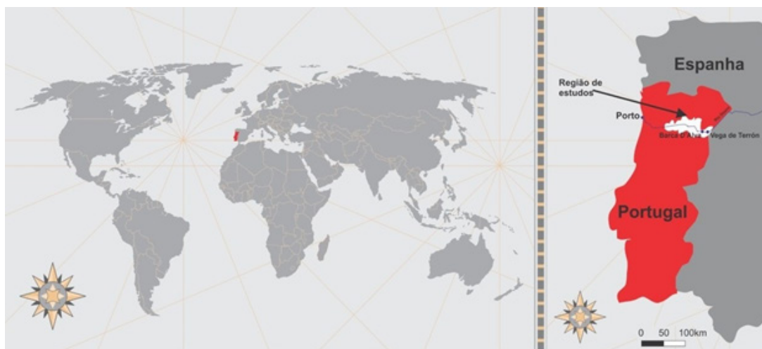
Figura 1 – Localização de Portugal, do Rio Douro e da região de estudos, no Norte português. Mapa das autoras.

A zona possui importância também no que tange a aspectos de biodiversidade, e ali se tem observado, de forma mais generalizada a partir de 2010, o surgimento e dispersão de um conjunto de novas práticas conjugadas à viticultura. O conjunto destas práticas culmina na implantação e gestão de infraestruturas denominadas “ecológicas” (Infraestruturas Ecológicas, IEs, exemplificadas nas Figuras 2 e 3) 3 que são consideradas, para efeitos deste estudo, como uma inovação de caráter agroecológico. As IEs se expressam por uma diversidade de modos, assumindo a forma de cultivos de vegetação nativa ou exótica, em crescimento espontâneo ou propositalmente semeadas, nas entrelinhas de cultivo das videiras ou nas áreas adjacentes, com os mais diversos propósitos, como servir de corredor ecológico aos animais nativos, abrigar insetos auxiliares, ampliar a biodiversidade das áreas de cultivo, proporcionar retenção da umidade do solo, ou reduzir as perdas por erosão.