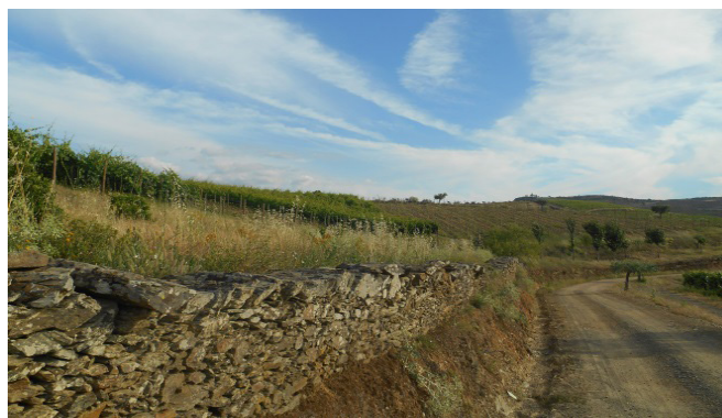
Figura 3 – Exemplicação de IEs sob a forma de um corredor ecológico perpendicular às linhas de vinha.

As informações que seguem trazem um encadeamento de fatores que se desenrolam na atual motivação dos viticultores do Douro a dinamizarem estruturas institucionais que os levaram a desenvolver estes novos métodos e técnicas, bem como a fomentar e difundir o conhecimento que subsidiou um princípio de transição, como se verá adiante.