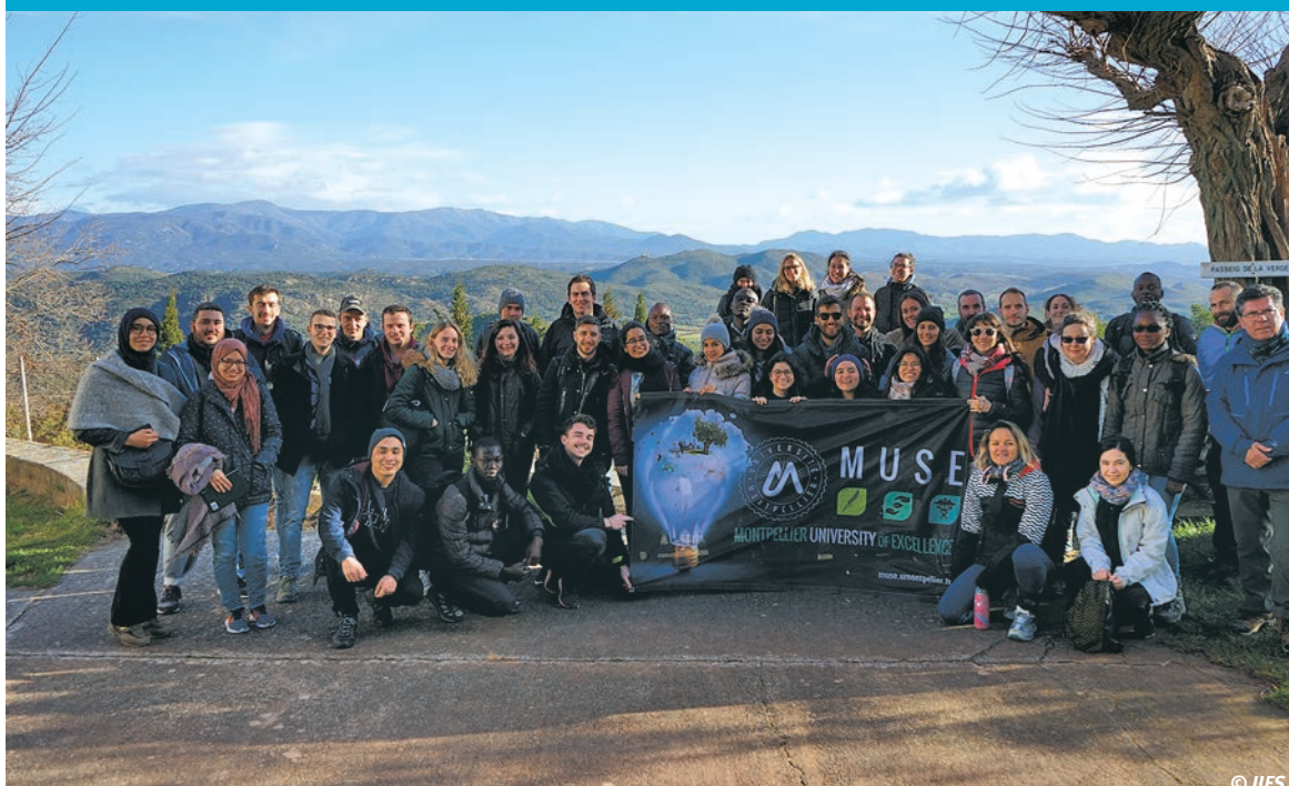
❶ Équipe internationale des étudiants et encadrants (France, Espagne, Tunisie, Côte d'Ivoire, Pays-Bas) lors de l'école interdisciplinaire et internationale MUSE Muga 2019 ( https://ifs-2018-2019-09.websself.net/accueil ).