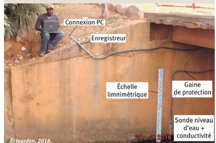
2 L'expert local relevant une station limnimétrique à Yaoundé 2016.