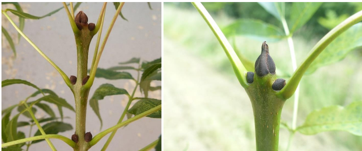
Bourgeons de frêne oxyphylle (à gauche) et de frêne commun (à droite).

Deux autres caractères distinctifs peuvent être relevés : le premier est l'aspect et l'insertion des bourgeons. Ceux du frêne oxyphylle sont souvent organisés par trois, au lieu de deux chez le frêne commun ; chez celui-ci, ce phénomène est quasiment inexistant. Noter la présence de feuilles insérées par trois au lieu de deux, un phénomène relativement fréquent chez le frêne oxyphylle.