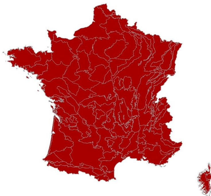
Carte des conseils d'utilisation du frêne oxyphylle

Attention, les conseils d'utilisation sont également soumis à l'autécologie du frêne oxyphylle, décrite en deuxième page.