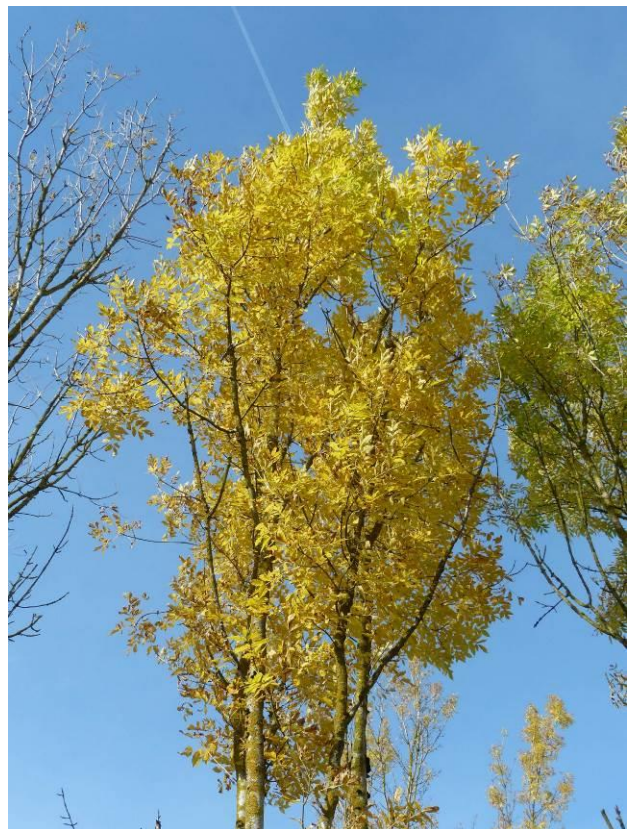
Coloration automnale du frêne oxyphylle (rouge) et commun (jaune).

Pour en savoir plus sur les frênes : www.fraxinus.fr