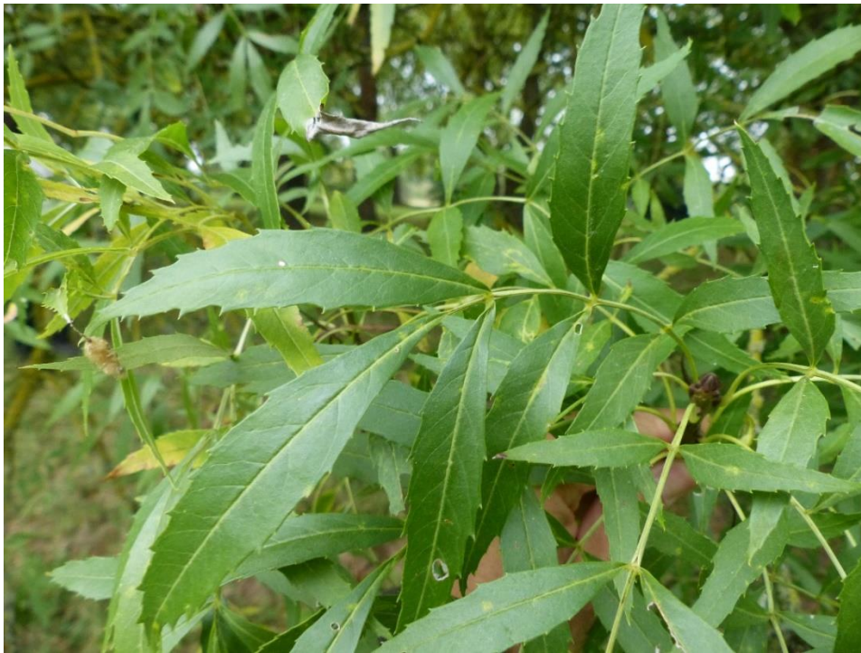
Feuilles de frêne oxyphylle.

Ensuite, les feuilles de frêne oxyphylle ont un aspect différent de celles du frêne commun :