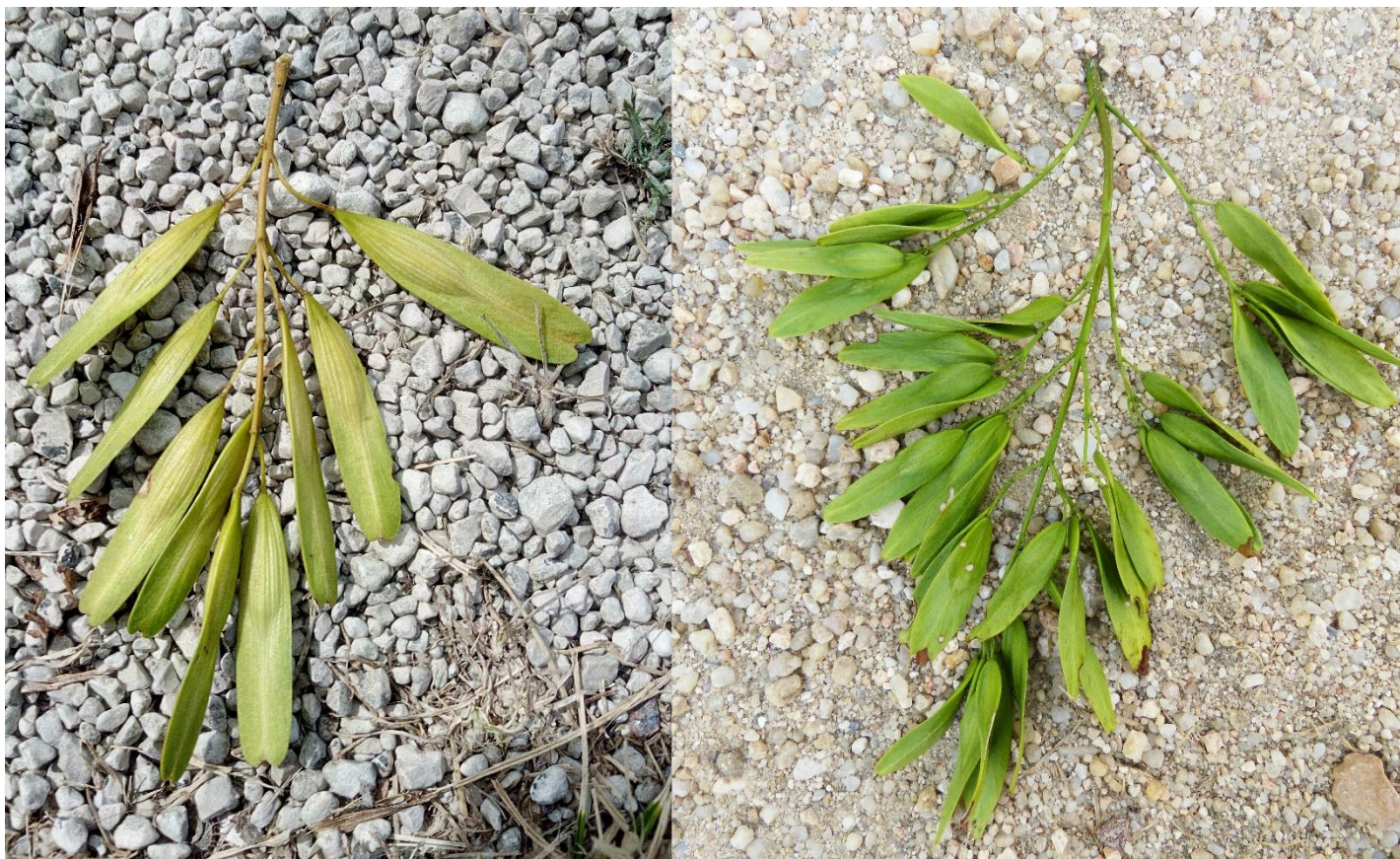
Comparaison des infrutescences du frêne oxyphylle (à gauche) et du frêne commun (à droite).

Le critère de distinction le plus fiable correspond au niveau de ramification des infrutescences. Elles sont toujours simples chez le frêne oxyphylle :