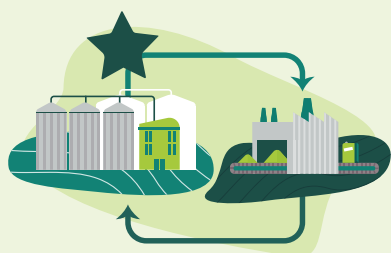
Nouvelles relations inter-entreprises sur un territoire