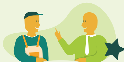
Offres de services des coopératives agricoles