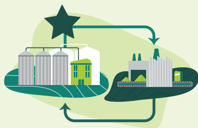
Nouvelles relations inter-entreprises sur un territoire