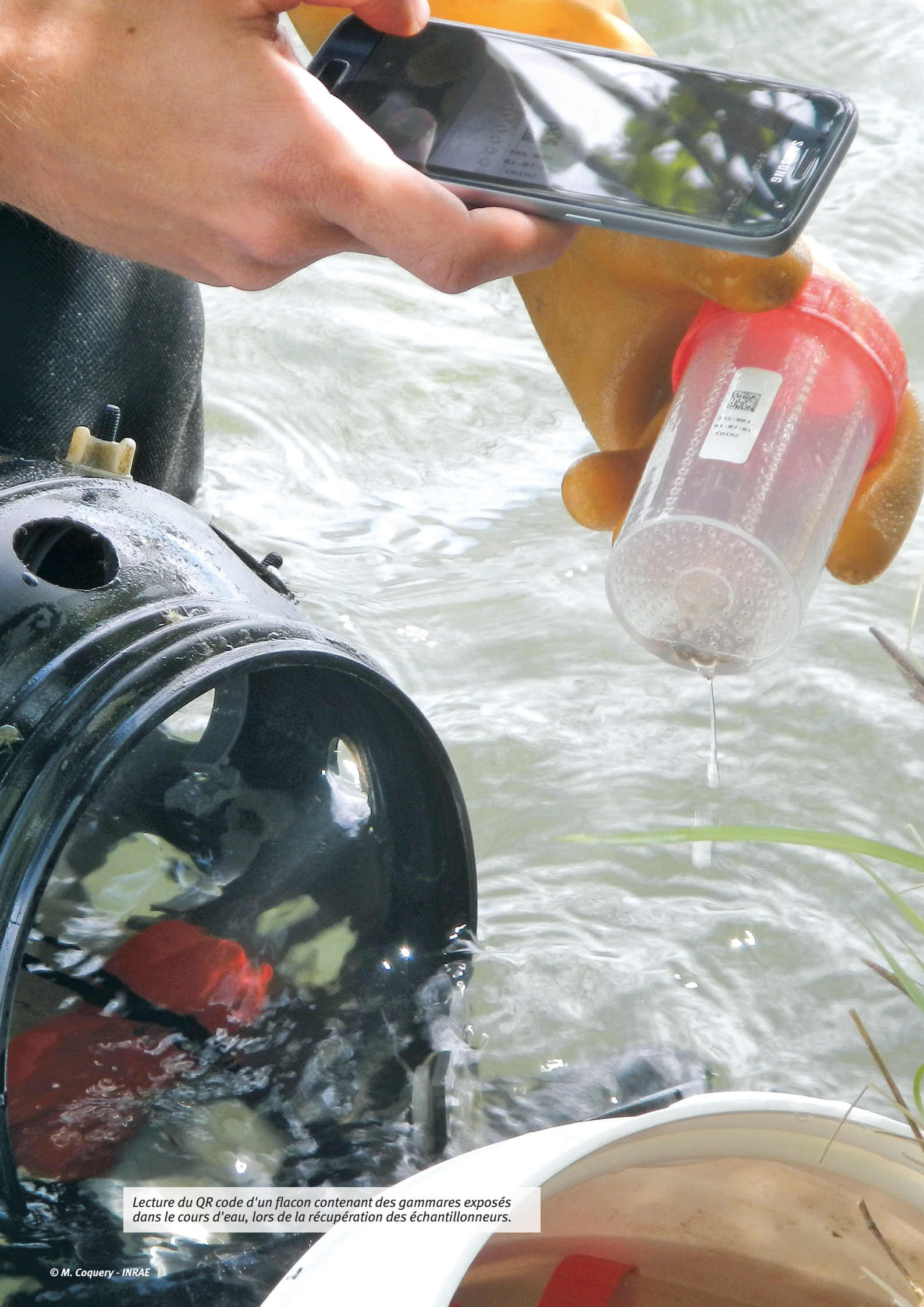
Lecture du QR code d'un flacon contenant des gammars exposés dans le cours d'eau, lors de la récupération des échantillonneurs.