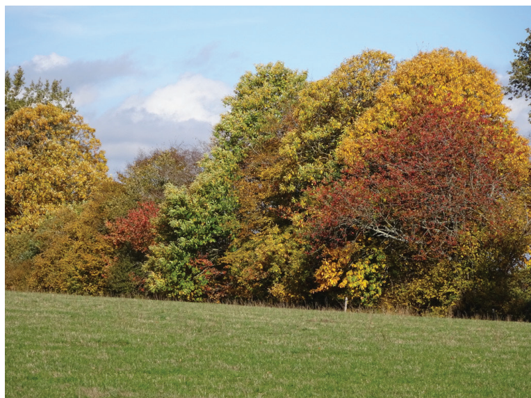
Lisière agro-forestière. Exemple d'une lisière entre la forêt et un champ.