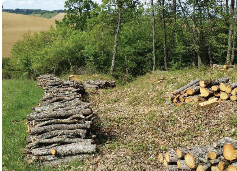
Coupe en lisière. L'exploitation du bois, notamment de chauffage, est plus facile en lisière.

Les lisières ne relèvent aujourd'hui ni des problématiques proprement agricoles, ni non plus de celles du monde forestier. Dans le découpage disciplinaire, politique et technique actuel, les lisières sont des objets intermédiaires, marginaux, sur qui se porte rarement l'attention. Les gestionnaires des territoires les tiennent pour une résultante de l'hétérogénéité des paysages liée à la juxtaposition de différentes occupations des sols. De fait, les lisières sont le lieu concret où se matérialisent les compétitions entre les enjeux forestiers et agricoles pour l'usage des sols. Le recul des forêts, par endroits, leur expansion, dans d'autres, déplacent les lisières historiques. Ces évolutions sont directement liées aux dynamiques sociales et démographiques des territoires. Pour penser les nouveaux équilibres à prévoir entre les productions agricoles et forestières dans une économie humaine impactée par le changement climatique en cours, pour anticiper