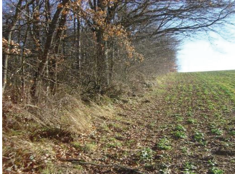
Lisière agro-forestière. Exemple d'une lisière entre la forêt et un champ.

Dans d'autres régions du monde, ces processus de différenciation et de fixation des structures ont été moins prégnants. Les paysages résultants comportent plus de zones de transitions et des discontinuités moins marquées. Par exemple, le passage de la savane à la forêt dense en Afrique de l'ouest se fait très progressivement sans qu'il soit aisé de distinguer une discontinuité nette. De la même façon les limites tendent-elles à s'estomper dans les paysages en déprise agricole du fait de l'extension naturelle des espaces arborés. Les friches, les accrus naturels forment des occupations sur sol transitoires et intermédiaires entre les milieux purement agricoles et forestiers, rendant difficile