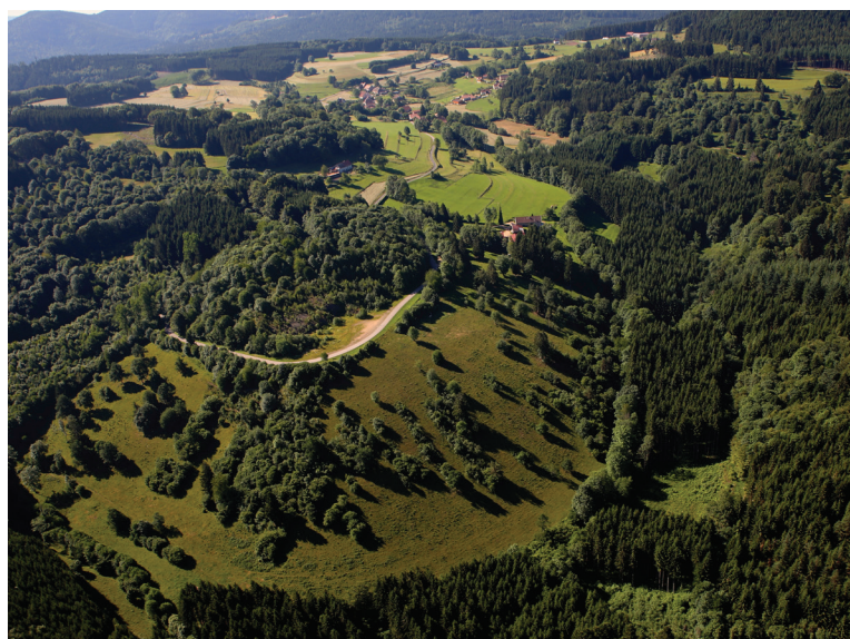
Lisières en Vallée de la Bruche.