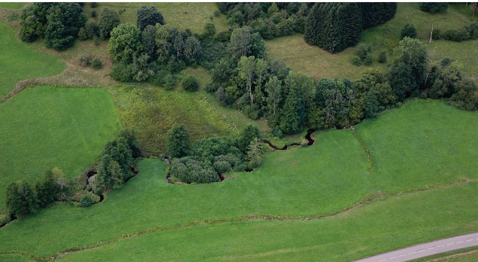
Lisières en Vallée de la Bruche.