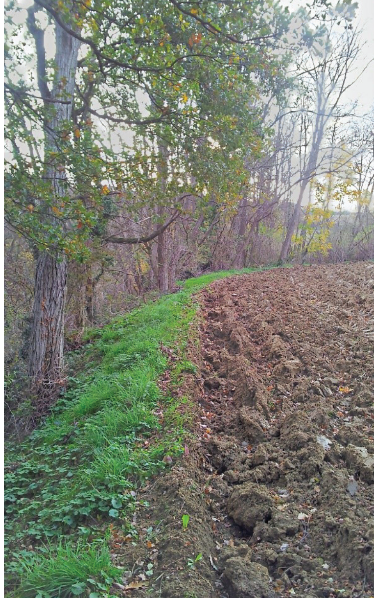
Lisière avec une parcelle cultivée. La végétation forestière est contenue pour ne pas s'étendre sur la culture. On note que le travail du sol a provoqué la formation d'un talus d'érosion qui marque aussi la lisière.

Le facteur le plus fréquemment utilisé pour caractériser les lisières est la structuration de la végétation. Les lisières sont décrites schématiquement comme composées de bandes de végétation disposées de part et d'autre de la limite entre la forêt et le milieu non forestier. On parle ainsi d'ourlet herbeux, arbustif puis arboré, leur composition et leur structure évoluant conjointement. Selon la présence, l'absence ou la taille de ces différentes bandes, on distingue des faciès de lisières abruptes, qui font passer presque sans transition du milieu ouvert au milieu boisé, et des lisières graduelles si différentes bandes de végétation se succèdent d'un milieu