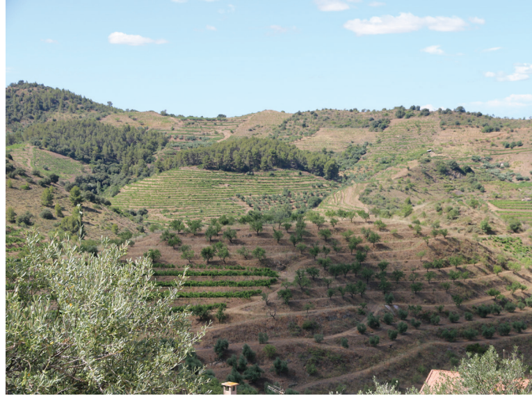
Lisières agro-forestière. Mosaïque paysagère du Priorat, Catalogne.

Une lisière modifie les caractéristiques écologiques des milieux adjacents et la répartition des espèces animales et végétales qui y définit la biodiversité locale (Ries et al. 2004). Il est souvent fait référence à un « effet de lisière » dont la littérature scientifique évalue différemment les impacts. En lien avec la fragmentation des espaces, certaines contributions présentent la lisière comme une menace pour la biodiversité. D'autres soulignent ses richesses floristiques et faunistiques. Cette divergence correspond à deux niveaux d'analyse qui ne portent pas sur les mêmes processus. Les grandes surfaces