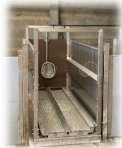
Abreuvoir connecté UE3P Saint-Gilles (x2/bande)

→ Variables étudiées : Volume d'eau bue (L/j), Fréquence (nombre de visite à l'abreuvoir/j) et durée (min/j) → 53 truies analysées (enregistrement complet)