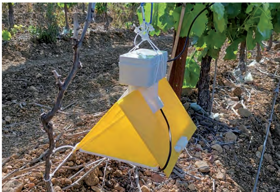
Piège à insectes connecté.

Les connaissances scientifiques et techniques pour accompagner la transition vers de nouveaux systèmes de production (agroécologie avec ses déclinaisons comme l'agriculture biologique, la protection intégrée ou l'agroforesterie) sont encore en construction. Or, pour diffuser largement ces modèles agroécologiques et permettre leur changement d'échelle, il est urgent d'en comprendre les mécanismes (Altieri et al., 2012) et de construire des références (Vanloqueren et Baret, 2009). En agroécologie, tous les niveaux de diversité et de régulations biologiques – intraspécifique, interspécifique ou fonctionnelle (couplage végétal-animal, écologie des paysages) – peuvent être mis en œuvre pour rendre les systèmes résilients (Caquet et al., 2020). Le revers est la profusion des possibles – choix variétaux, assemblages d'espèces, couplages entre culture et élevage – qui rend a priori impossible l'ambition de créer une connaissance sur l'ensemble du champ des possibles. Face à ce défi, les modes de construction de la connaissance doivent être renouvelés et le numérique permet de construire ces connaissances essentielles à la transition agroécologique (Leveau et al., 2019) avec trois leviers