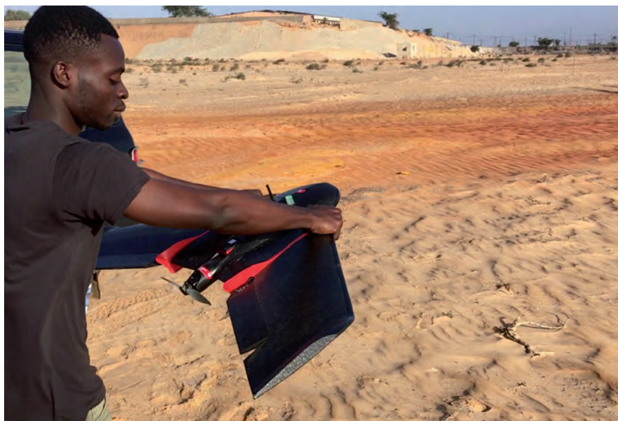
Décollage d'un drone de cartographie au Sénégal.

(mauvaises herbes, insectes et autres ravageurs, et maladies). L'élevage de précision implique de suivre en temps réel l'environnement (mesure d'ambiance dans les bâtiments ou en conditions extérieures) et les animaux avec, depuis une vingtaine d'années, des capteurs sur l'animal ou dans son environnement disponibles surtout pour les élevages laitiers : identification et géolocalisation par RFID ou GPS, imagerie (2D, 3D, infrarouge), accéléromètres, sons, automates de mesure (balances, compteurs à eau, à lait, distributeurs d'aliments) ( Chastant-Maillard et Saint-Dizier, 2016 ). Les paramètres suivis sont divers : la croissance, la production de lait, l'ingestion alimentaire, le statut physiologique, le comportement, la reproduction, la santé et le bien-être (détection de boiteries, troubles digestifs, etc.)... ( Benjamin et Yik, 2019 ; Fournel et al., 2017 ; Halachmi et al., 2019 ; Knight, 2020 ; Neethirajan, 2017 ; Rowe et al., 2019 ; Veissier et al., 2019 ; Xin et Liu, 2017 ). Aujourd'hui, ces techniques visent plutôt les élevages conventionnels mais des solutions se développent pour les systèmes alternatifs, par exemple avec des dispositifs de suivi des animaux et du pâturage ( Shalloo et al., 2018 ) pour améliorer l'efficacité des systèmes extensifs basés sur l'herbe, plafonnée sinon par le manque de données, et garantir la conduite responsable de l'élevage auprès des consommateurs ( Neethirajan, 2017 ).