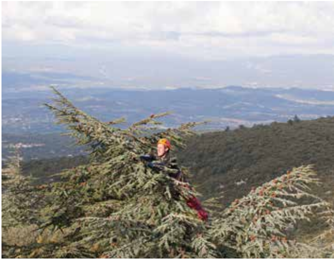
Récolte de cônes de cèdre de l'Atlas, provenance française.