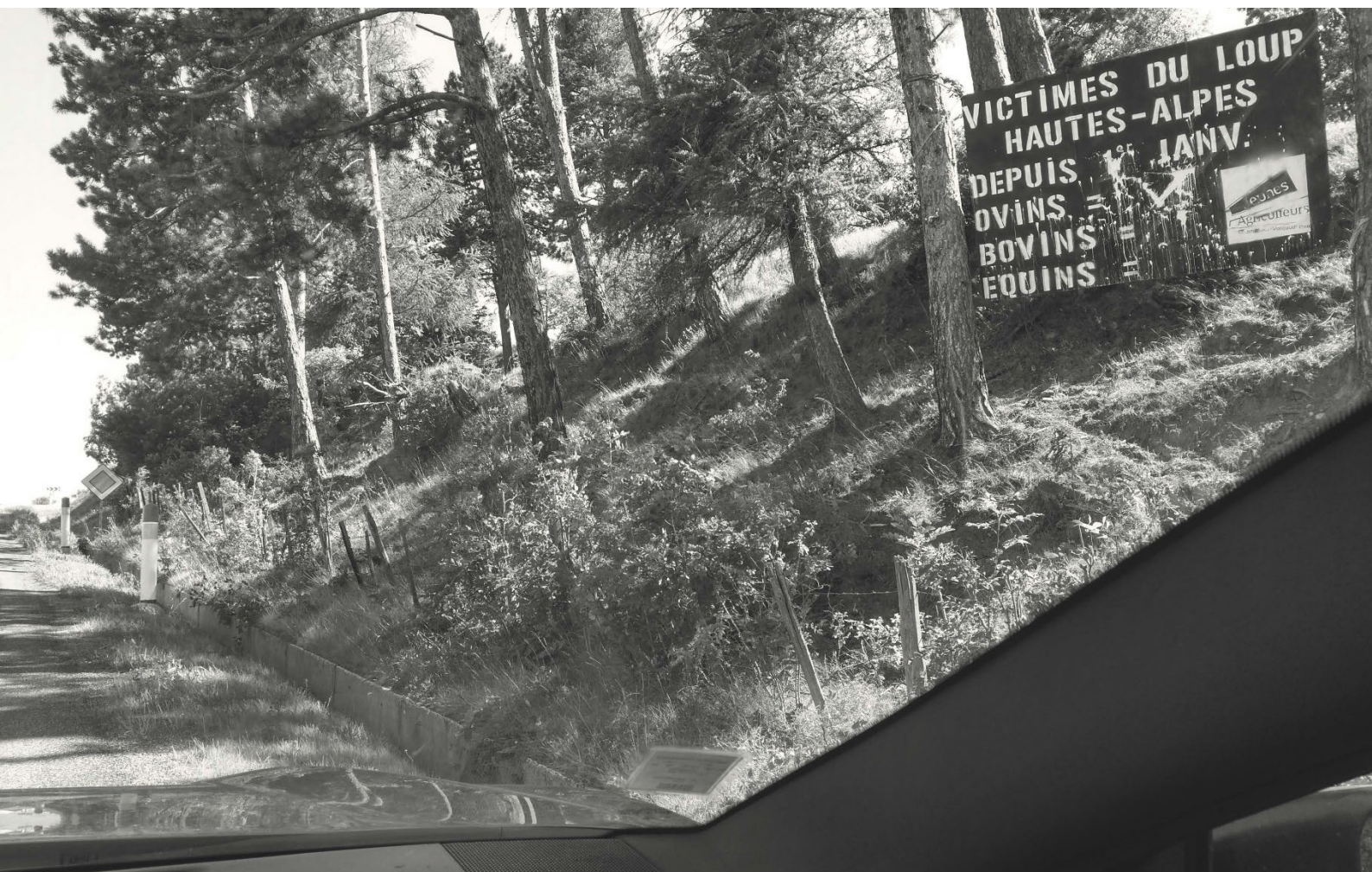
Bord de route dans les Hautes-Alpes : panneau endommagé destiné au décompte des victimes du loup

« Autant on partage un constat peut-être, et après derrière par contre on n'est pas d'accord sur [...] la manière dont on doit gérer la problématique [...] Là, ce qu'il y a, c'est qu'il y a toujours ce problème de posture syndicale, où on a l'impression que parler du loup c'est l'accepter ».