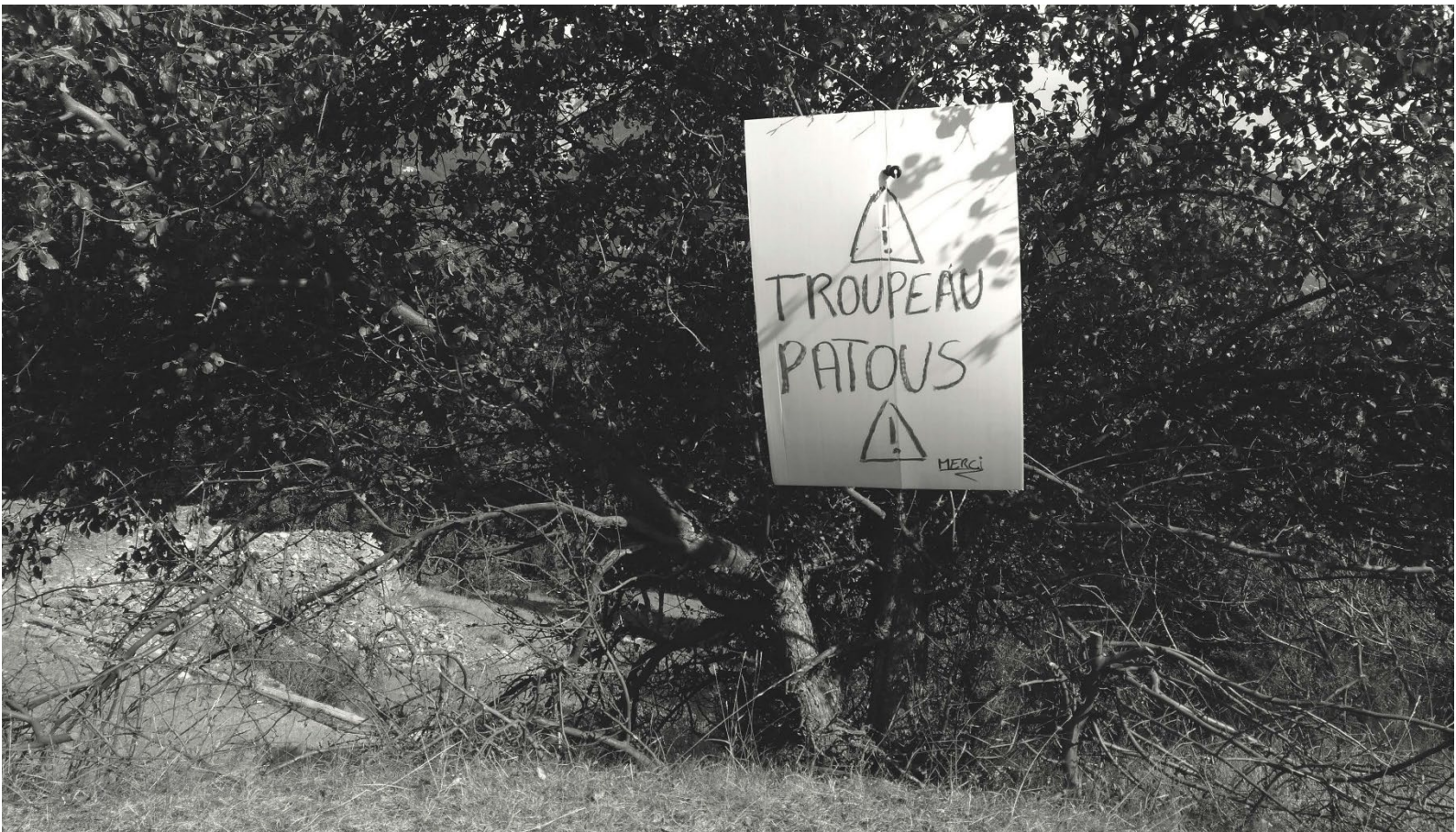
Avertissement !