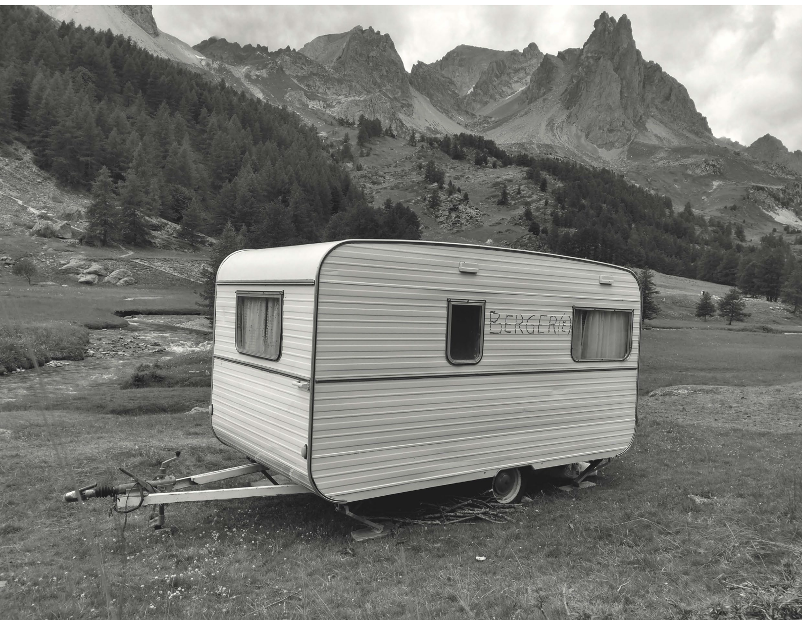
Caravane pour berger.e - Vallée de la Clarée