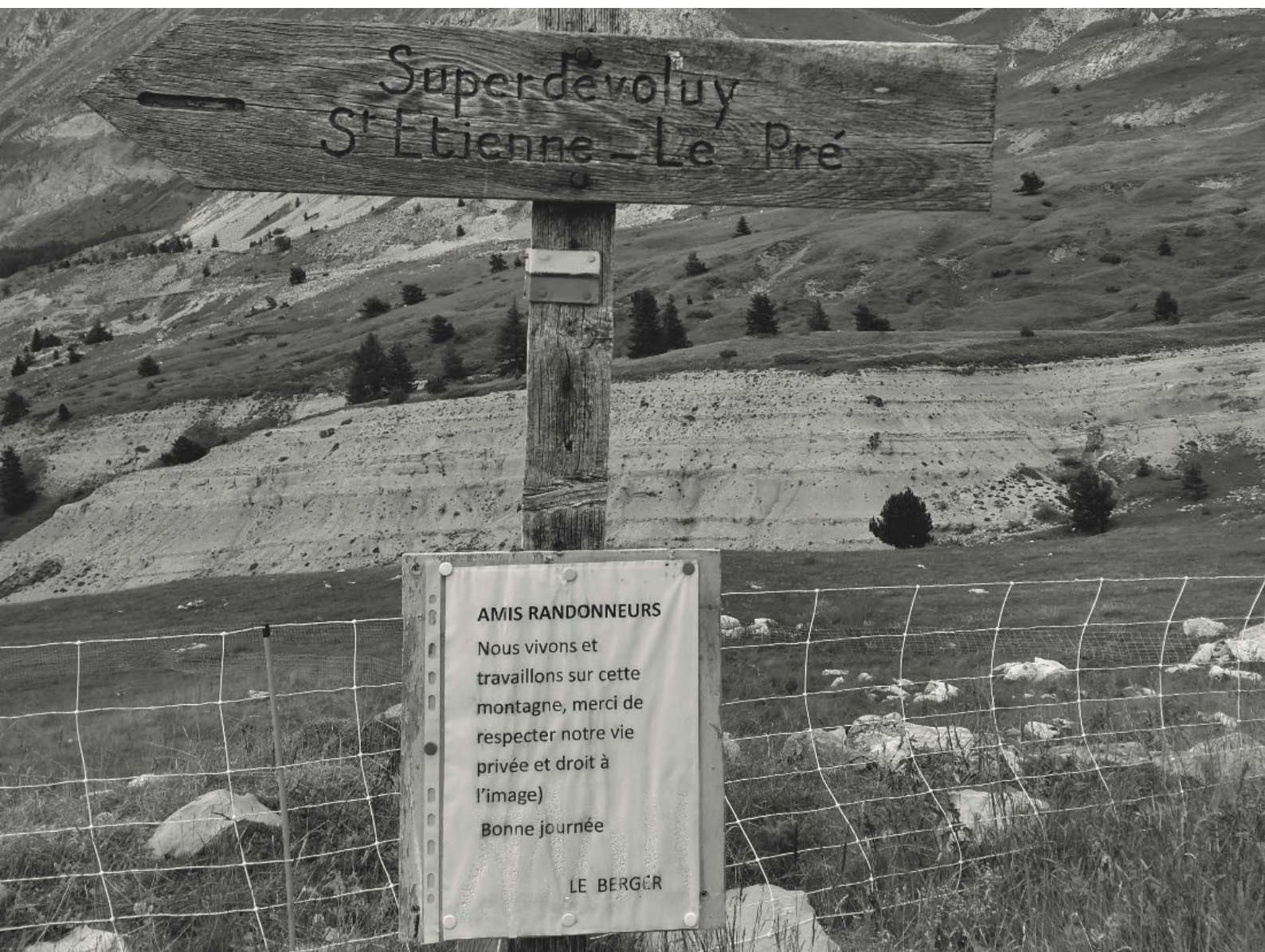
Vivre au milieu des randonneurs - Dévoluy

« Les gens ne comprennent pas que la montagne est un lieu de production, [...] ce n'est pas un parc d'attractions ».