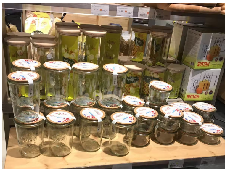
L'emballage, le sujet phare du vrac.

L'emballage constitue l'autre sujet phare en vrac. Celui-ci n'est en effet plus du ressort de l'industriel, mais du distributeur, qui en met, ou non, à disposition, et du consommateur, qui choisit ses contenants pour les adapter à ses usages (alléger le transport, réutiliser, mieux doser...). Enfin, la fixation du prix se voit bouleversée par rapport aux habitudes car la quantité de vente est non prédéfinie et « co-construite », au moyen de la balance, matériel au cœur du processus de vente.