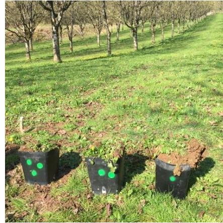
Figure 1 : A l'aide d'une bêche-plate (ou pelle-bêche) des échantillons d'environ 2-2.5Kg ont été prélevés ( \approx 15 \times 15 \times 20 cm)

En laboratoire, chaque échantillon a ensuite été traité de la façon suivante :