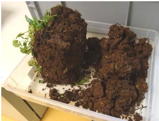
Figure 2 : Séparation de la partie superficielle ( \approx 10 cm) et de la partie profonde