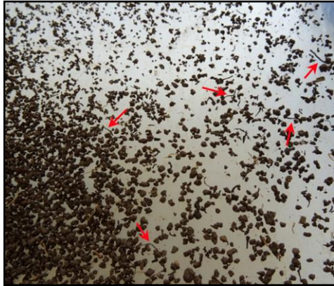
Figure 4 : Sol racinaire de noyer tamisé avec fragments racinaires (flèches rouges)