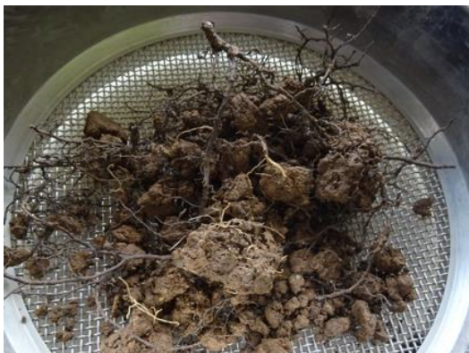
Figure 3 : Racines de noyer avec sol encore attaché aux racines secondaires

Le sol racinaire du noyer a ensuite été séparé des racines à l'aide d'un tamis (2 mm) en récupérant les fragments de racines passés à travers le tamis (Figure 4). Après un rinçage à l'eau, une quantité suffisante des racines de noyers pour l'extraction de l'ADN (étude de la diversité en CMA) et pour la coloration (étude du taux de mycorhization) a été prélevée avec des ciseaux. La partie aérienne des plantes a été coupée. Les cailloux et le sol éloigné des racines ont été séparés des racines du couvert (tamis de 4 mm). Comme pour le sol racinaire de noyer, le sol racinaire du couvert a été récupéré à travers le tamisage (tamis de 2 mm).