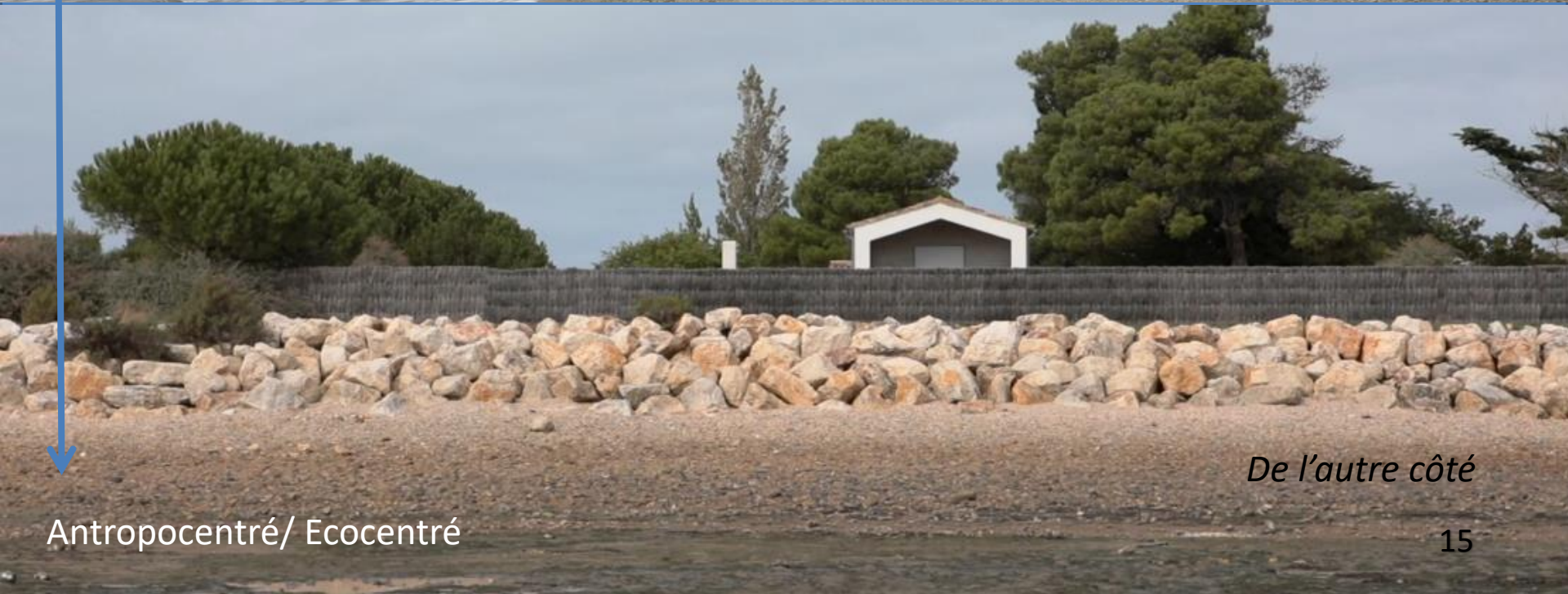
De l'autre côté