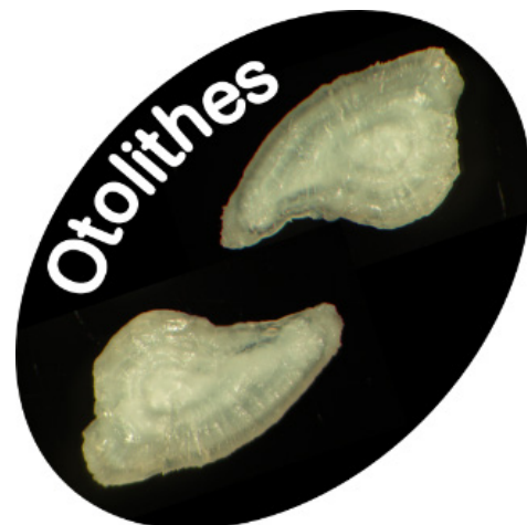
Figure 2. Otolithes de truite fario

Les poissons possèdent une oreille interne qui contient de petites structures calcaires appelées otolithes (Figure 2). Leur coupe