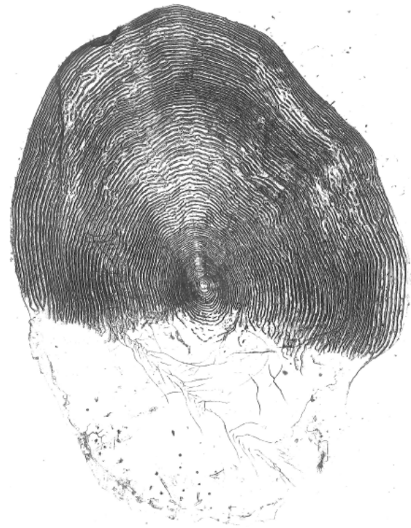
Figure 1. Écaille de saumon atlantique

Les écailles (Figure 1) constituent une grande partie de la collection du CRB COLISA de par la simplicité de leur conservation, de leur stockage (dans une enveloppe en milieu sec) et la facilité de leur échantillonnage. Les écailles présentent l'avantage de pouvoir être collectées sur un poisson vivant. Elles sont utilisées pour déterminer l'âge et la croissance ainsi que pour des analyses génétiques ou microchimiques (Marchand, 2006).