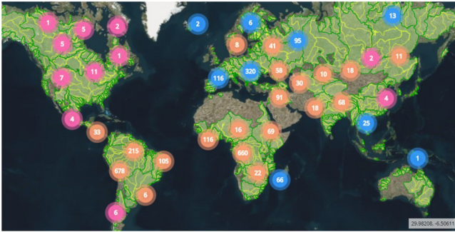
Figure 1. Stations virtuelles disponibles sur Hydroweb pour le suivi des lacs et rivières.