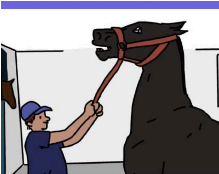
Figura1: The Revenant, en formación en la escuela Blondeau.