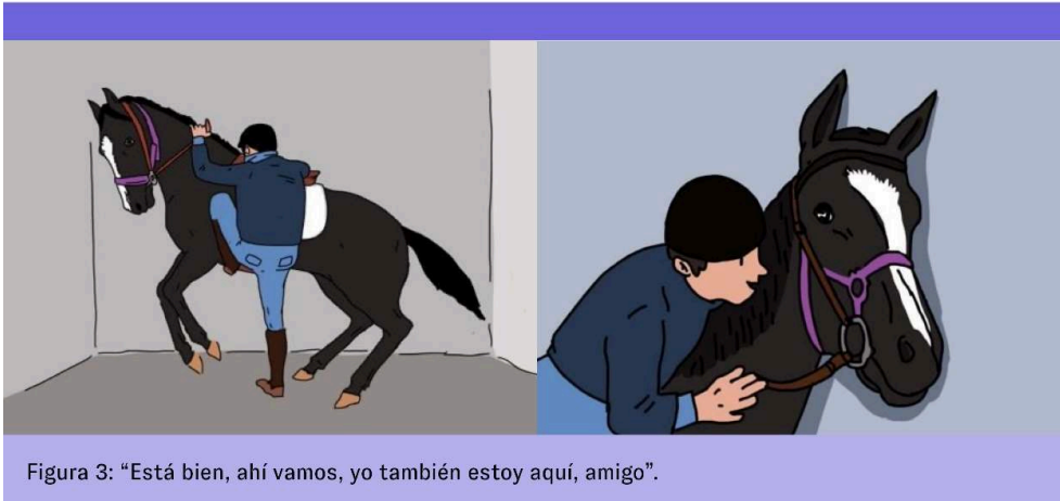
Figura 3: “Está bien, ahí vamos, yo también estoy aquí, amigo”.