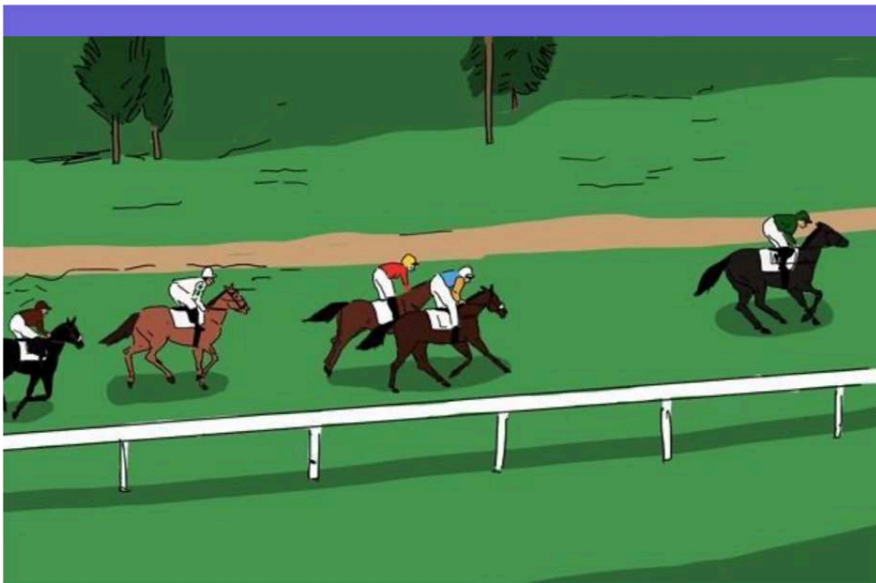
Figura 4: “The Revenant, número 8, remonta y saca ventaja...”