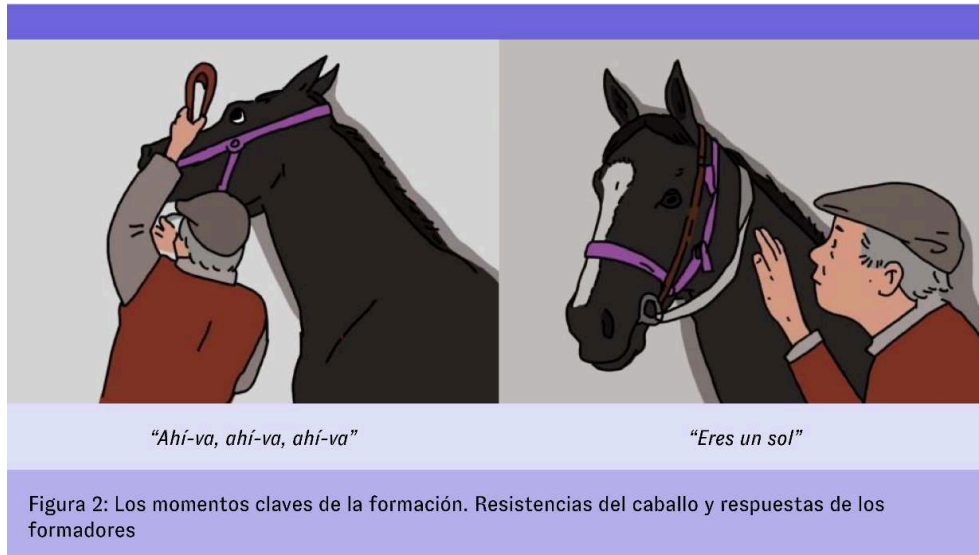
Figura 2 – Los momentos claves de la formación. Resistencias del caballo y respuestas de los formadores