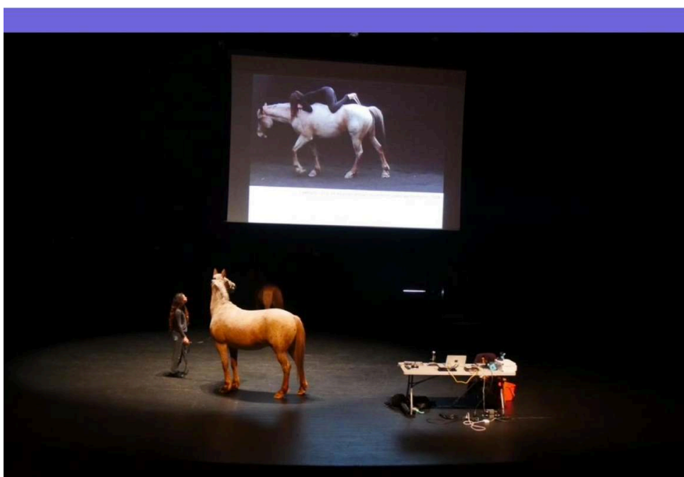
Figura 3: Conscience de soi? , teatro La Vignette, Paul-Valéry Montpellier 3, coloquio Ciencias cognitivas y espectáculo en vivo , invitados por el RIRRA21, 26 de abril de 2017.