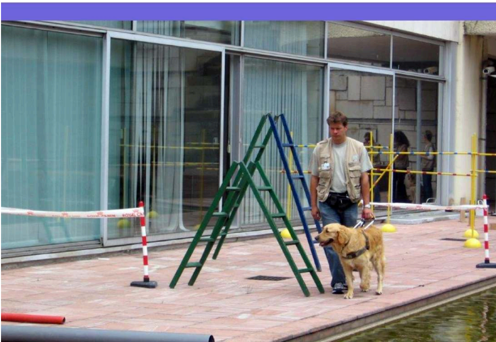
Foto 2: Ejercicio en modo sistemático en el exterior de la ECGA.