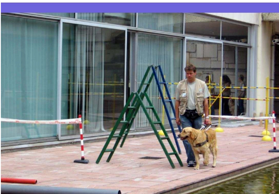
Foto 2: Ejercicio en modo sistemático en el exterior de la ECGA.