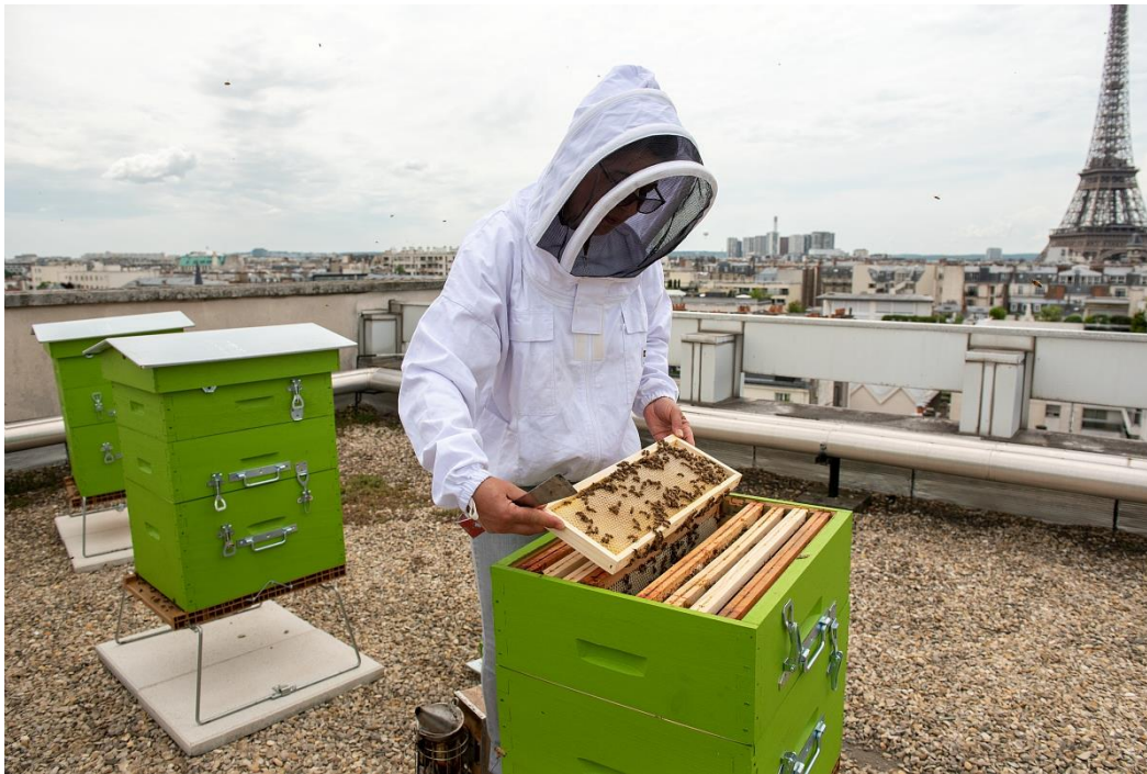
Figure3. Apiculture urbaine sur le toit du siège Inrae à Paris.