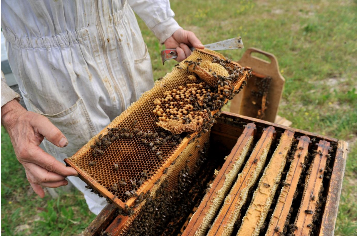
Figure 1. Ruche à cadres mobiles.