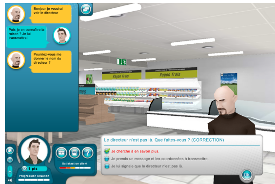
FIGURE 2 – Interface de dialogue dans Format-Store.

avec qui »). Ces informations sont ensuite traitées par un moteur de simulation générique.