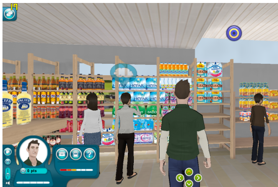
FIGURE 1 – Vue de l’avatar du joueur dans le magasin virtuel.