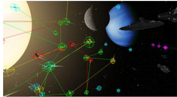
FIGURE 5 – Dans Galaxian, on peut visualiser dynamiquement les interactions réalisées (et leur cible) au moyen de cercles colorés autour des agents qui les effectuent et de lignes vers les agents qui les subissent.

de façon à séparer la couche proprement graphique (rendu 3D, détection des collisions, physique, fluidité de l’animation) de la couche de choix des comportements. Deux équipes pilotées de façon entièrement autonome par l’ordinateur s’affrontent, principalement au moyen de chasseurs régénérés périodiquement par des croiseurs. Chaque agent est confronté à la perception d’un très grand nombre d’autres agents (figure 4), et dispose de peu de temps pour prendre sa décision (attaquer, fuir, rechercher une cible...). L’équipe blanche dispose également de comportements d’équipe comme la formation d’une escouade, cette dernière étant réifiée dans le modèle par un véritable agent (sans re-