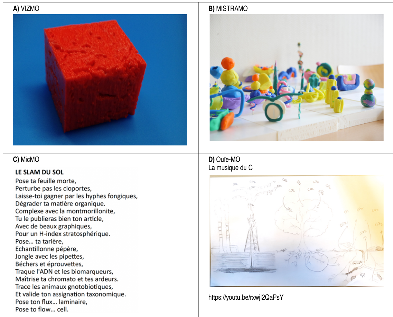
Figure 2: Examples of creations made during the researcher schools A) the physical object as a means of mediation (3D printed soil block at VIZMO); B) collective creation in modeling dough on the representation of isotopes in shapes and colors (MISTRAMO); C) Text written during writing workshops (MicMO); D) Using sound to explain our research topics, demo made during the sonification workshops (Ouïe-MO).

tion et mise en œuvre d'un outil de sonification et d'interprétation des données ; un projet sur l'impression 3D en science du sol (Arrieta-Escobar, 2020) ; des projets pédagogiques proposés lors de fête de la science suite à MISTRAMO (Candice Hayat/Marie-France Dignac, La petite fabrique des lombrics, Bestiaire en sous-sols, voir Hayat et Dignac, 2020) ; l'organisation d'une journée thématique Archéométrie des sens (Jacob et Mirabaud, 2022). Ce sont en outre des exemples de bénéfices réciproques pour artistes et chercheurs.