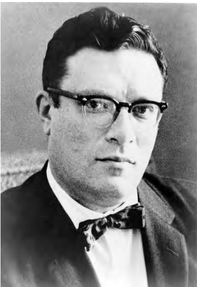
Isaac Asimov, en 1965

Qui ne rêve pas de trouver la bonne idée qui changera le cours de l'histoire ? Pour tenter de s'en approcher, les entreprises et les Etats multiplient les séances de brainstorming, sans pouvoir évaluer précisément leur efficacité. En 1959, l'écrivain de science-fiction Isaac Asimov avait participé à des recherches collectives à propos d'un bouclier antimissile pour l'armée américaine. C'est son ami, le scientifique Arthur Obermayer, qui l'avait invité à se joindre à des sessions de réflexions autour du projet militaire de l'Agence pour les projets de recherche avancée de défense. Asimov ne participa qu'à quelques réunions, de peur que sa liberté d'expression ne soit limitée par les informations confidentielles qu'il allait devoir traiter. Mais ce passage ne fut pas anodin, puisqu'il laissa derrière lui un texte en anglais sur la créativité. Plus d'un demi-siècle plus tard, son ami scientifique est retombé dessus et a décidé de le publier. Voici ses principaux conseils qu'il donne pour faire émerger une idée géniale.